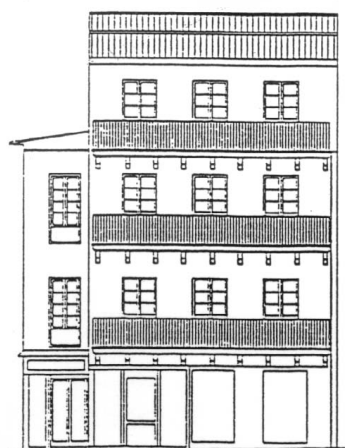
PLAZA DE LOS FUEROS