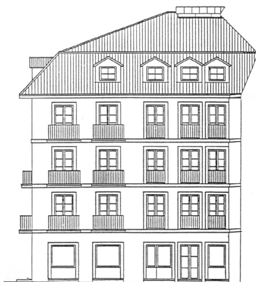
C./ SANCHOENEA Nº 27-29