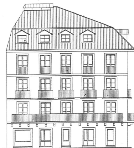
c./ VICENTE ELIZEGI