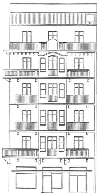
AVD. DE NAVARRA