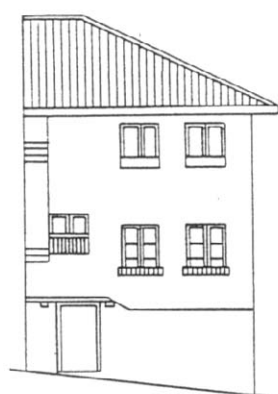
C./ IGLESIA Nº 25