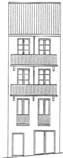
C./ IGLESIA Nº 19