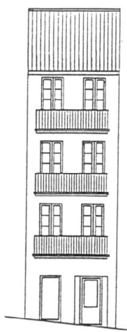
C./ ARRIBA Nº 12