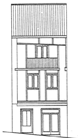
C./ARRIBA Nº 20