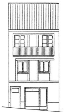
C./ ARRIBA Nº 22