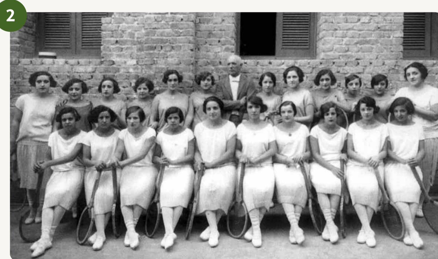
2 Lehen garaietako raketistak Kuban - Primeras raquetistas en Cuba (1924-1925)