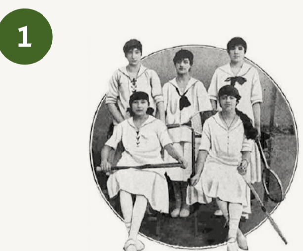
1 Lehen erakustaldia Madril - Primera exhibición en Madrid (1917) "Emakumea eta Euskal Pilota" - "Mujer y Pelota Vasca"