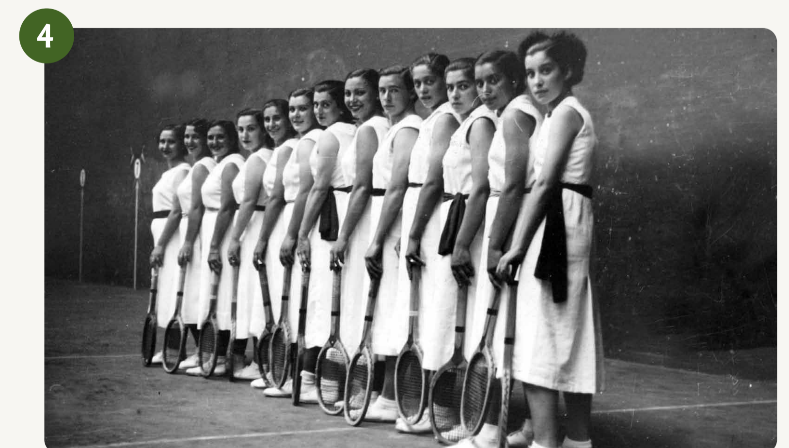
4 Gerra zibil garaiko Donostiako "Gros" frontoia Frontón "Gros" de Donostia de la época de la guerra civil (1938)