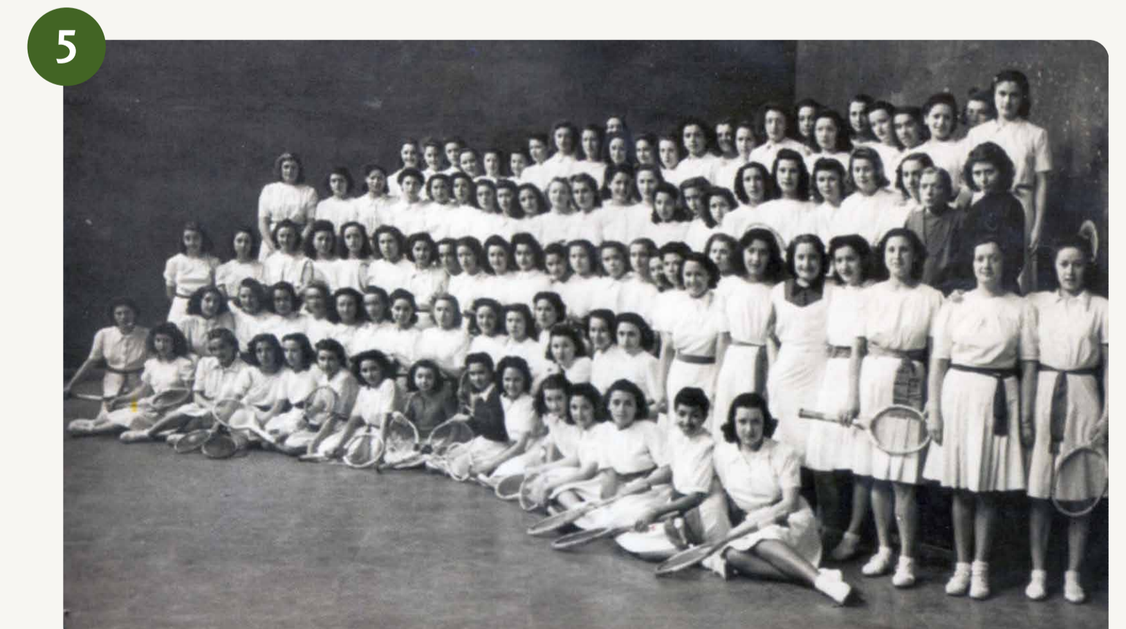
5 Bartzelonako "Nuevo Mundo" frontoiko kuadroa, 100 raketista Cuadro del frontón "Nuevo Mundo" de Barcelona, 100 raquetistas (1942) "La pilota a Catalunya" / "Federació Catalana de Pilota"