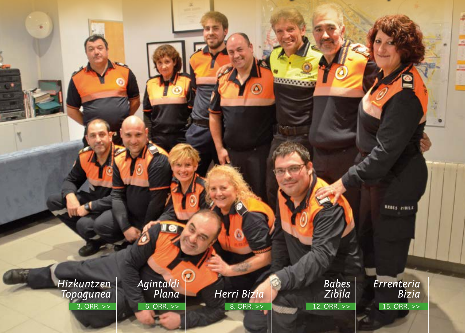
Hizkuntzen Topagunea 3. ORR. >>

BABES ZIBILA, BOLUNTARIOEN LAGUNTZA HERRIARI Protección Civil, voluntariado ayudando al pueblo