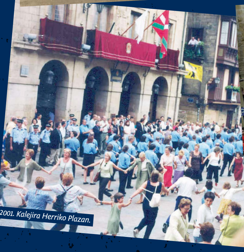
2001. Kalejira Herriko Plazan.