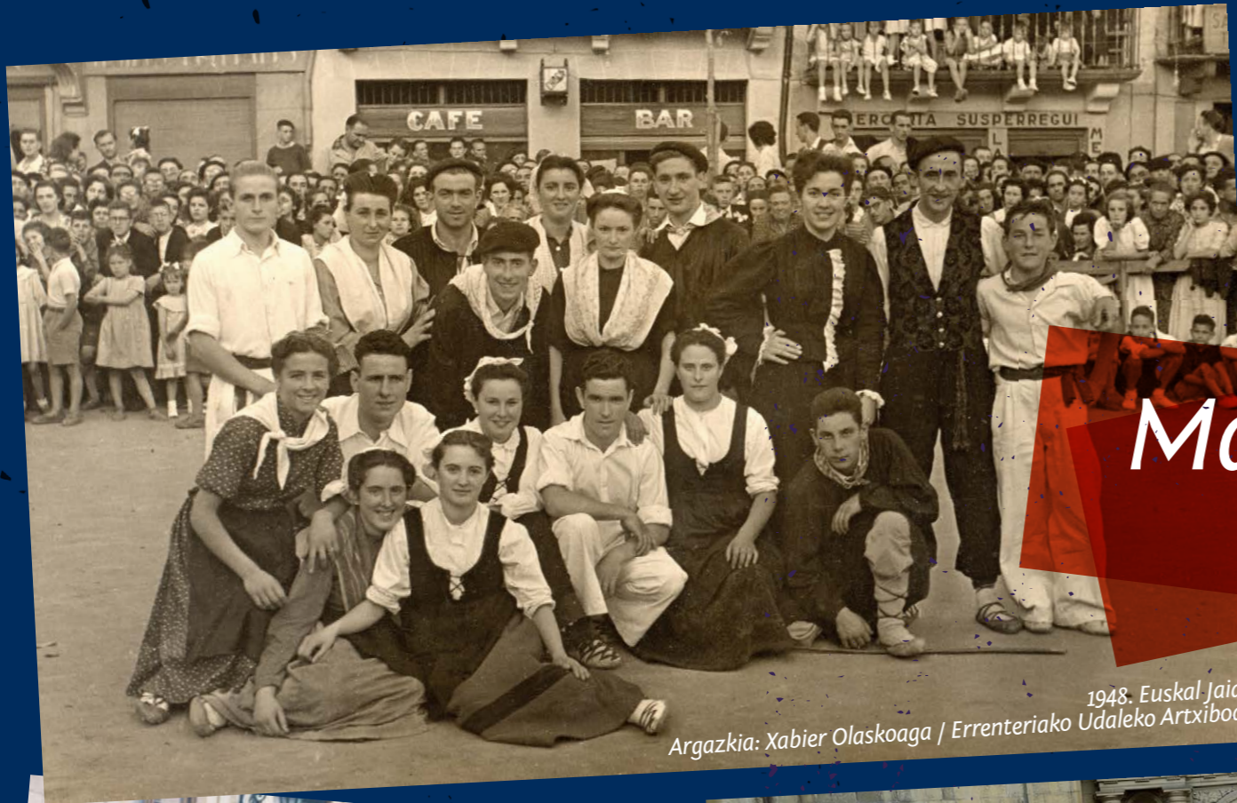
1948. Euskal Jaia.