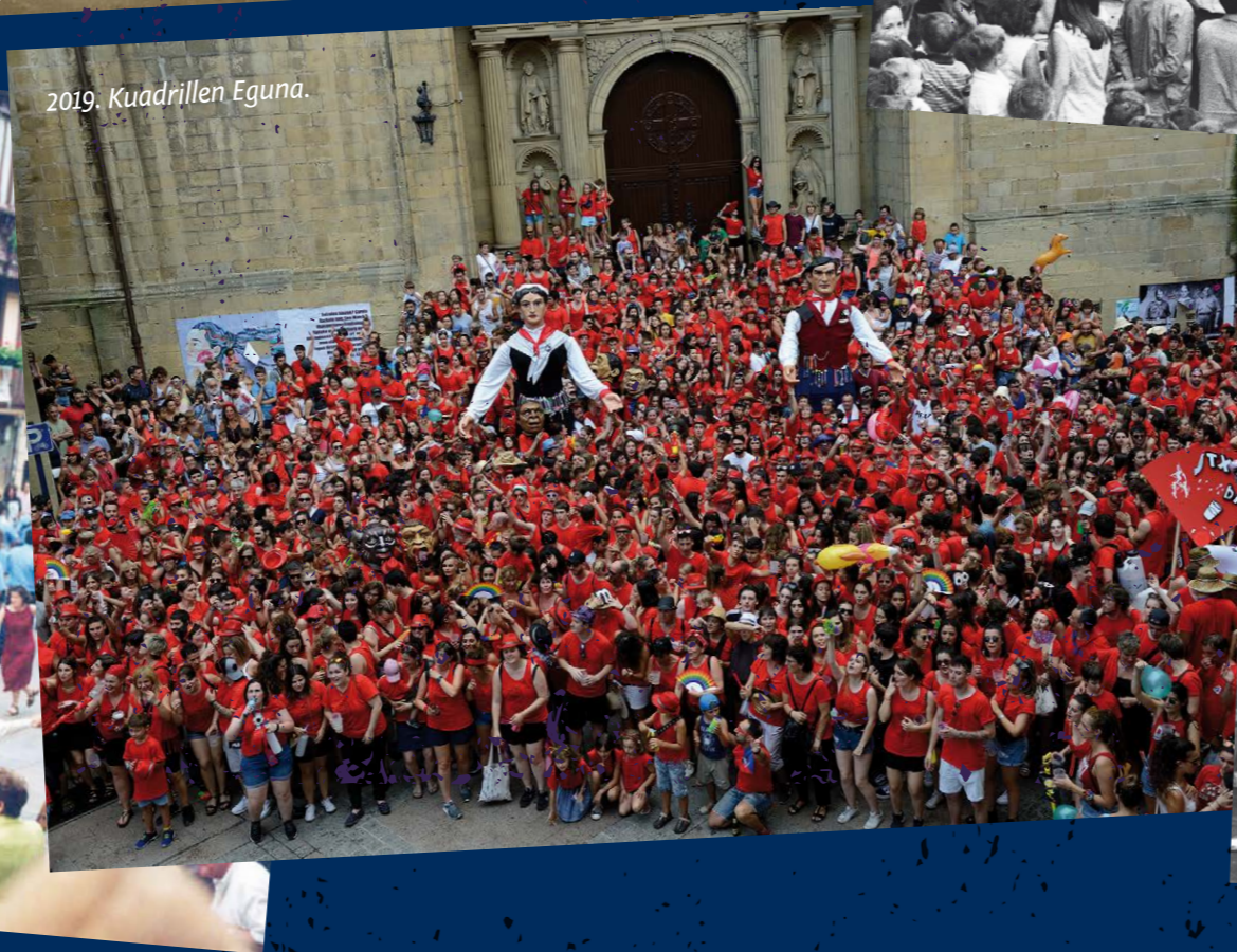
2019. Kuadrillen Eguna.