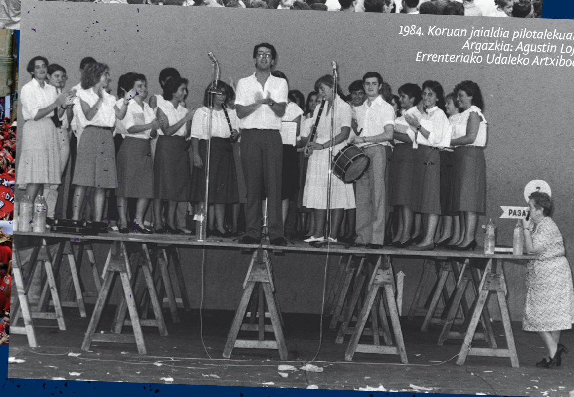
1984. Koruan jaialdia pilotalekuan.