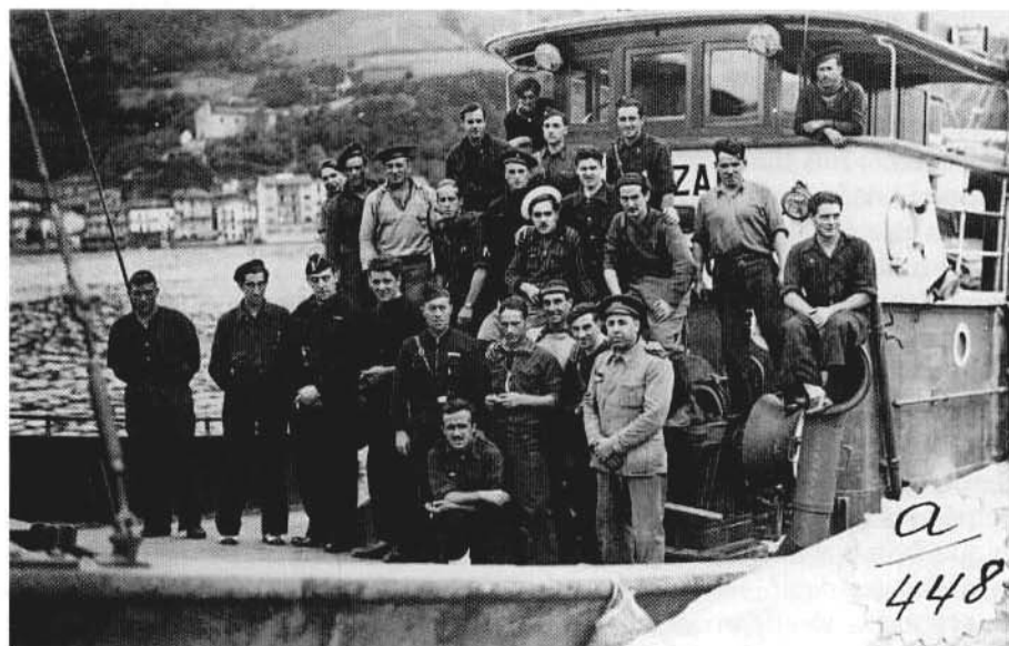
Foto 4.- La tripulación del Alcázar de Toledo , formada por voluntarios de Falange, en Pasajes en 1936.