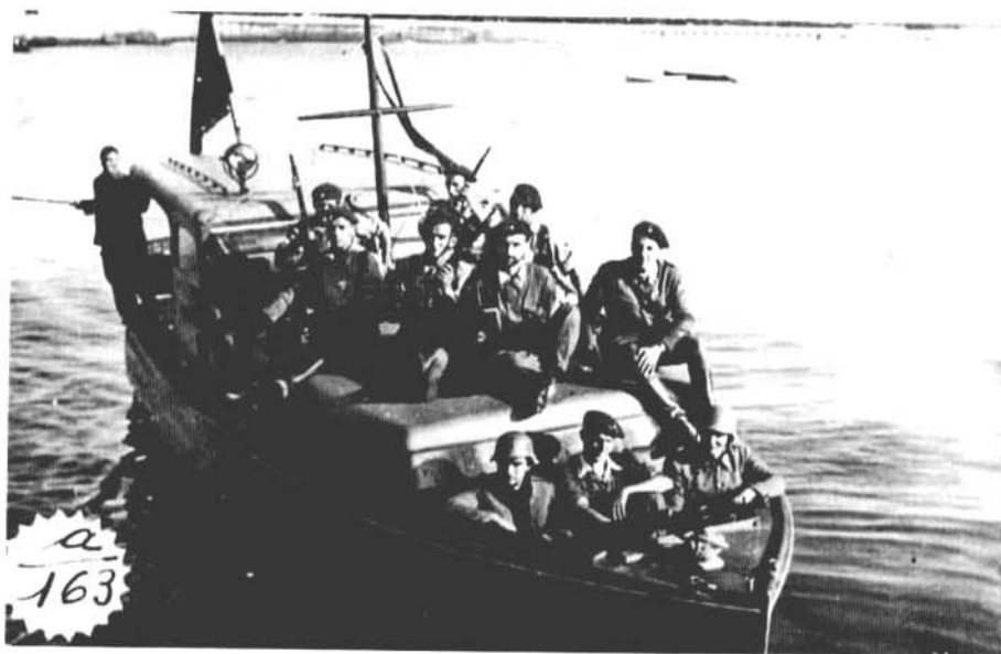
Foto 7.- La misma lancha de la fotografía anterior repleta de requetés en cubierta (Fototeca Kutxa, San Sebastián).