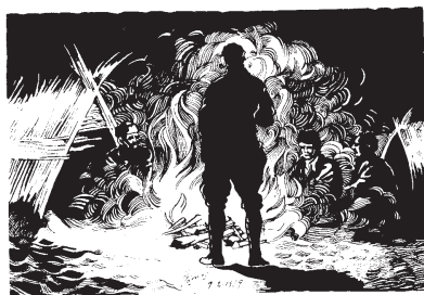
Escenas de la vida diaria en el campo de Argelès en 1939. Dibujos de Nicomedes Gómez.