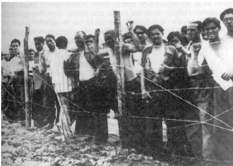
Grupo de refugiados vascos en el campo de concentración de Gurs en el verano de 1939.