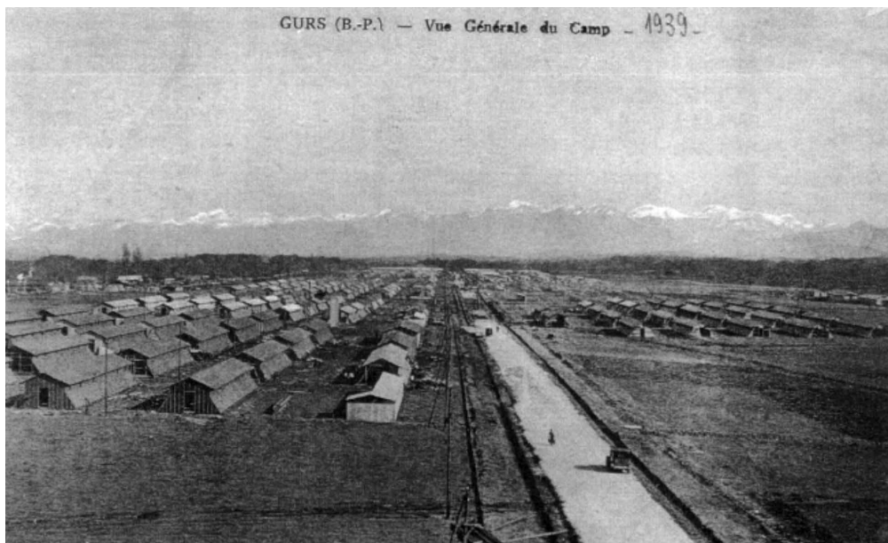
Panorámica del campo de concentración de Gurs en 1939.

esta manera, el enfrentamiento político y la división del exilio republicano se mantiene incluso en este ámbito.