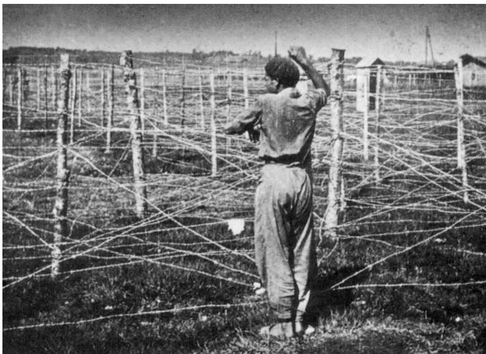
Dos imágenes del campo de concentración de Gurs, en Bèarn, adonde irían a parar miles de refugiados republicanos, entre ellos muchos vascos.