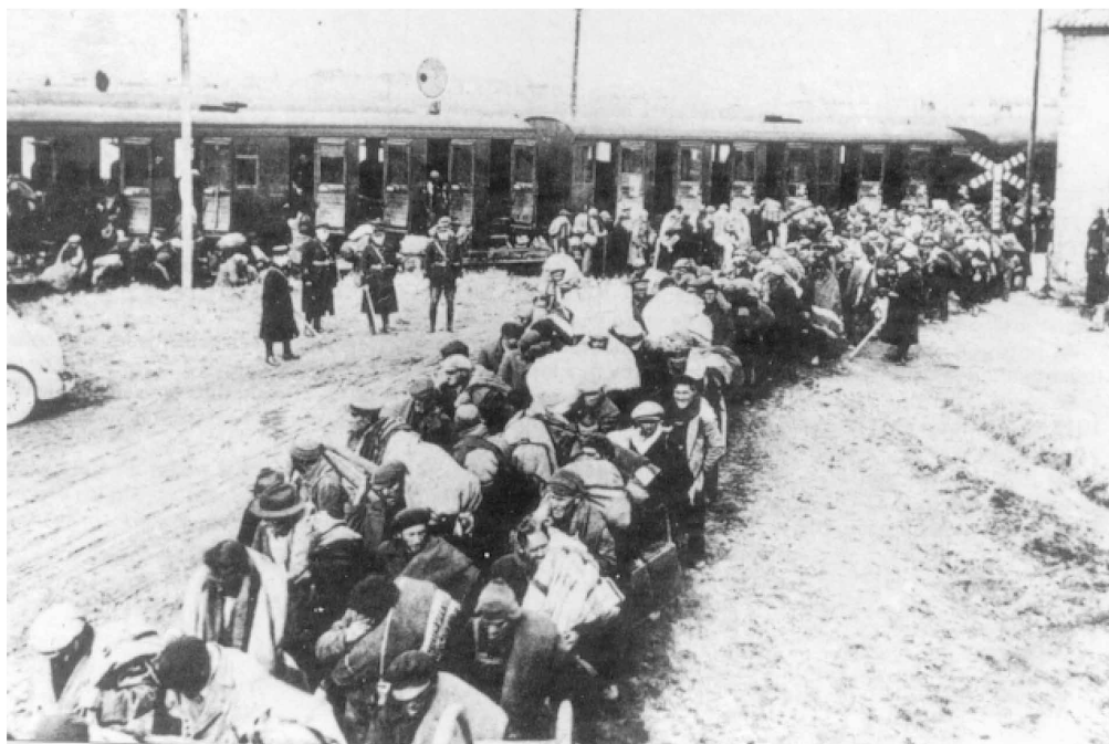
1939. Tras la derrota, miles de refugiados republicanos son conducidos a los campos de concentración de Francia.