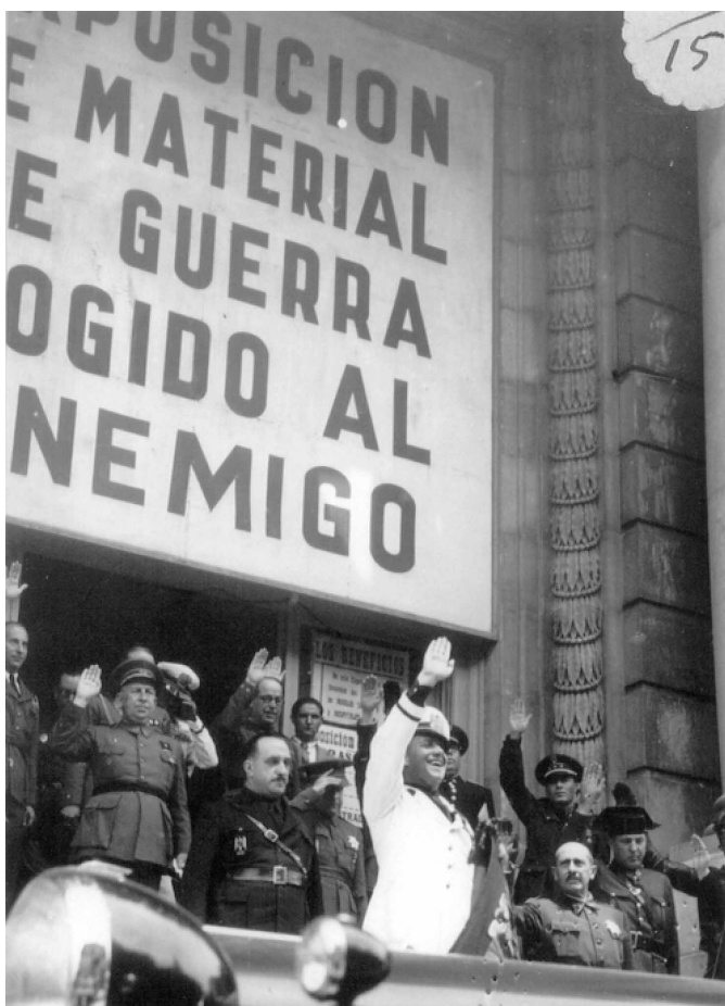
14 de julio de 1939. Ciano visita la "Exposición de material cogido al enemigo" organizada en el palacio del Kursaal de San Sebastián. A su izquierda, el conde de Jordana.