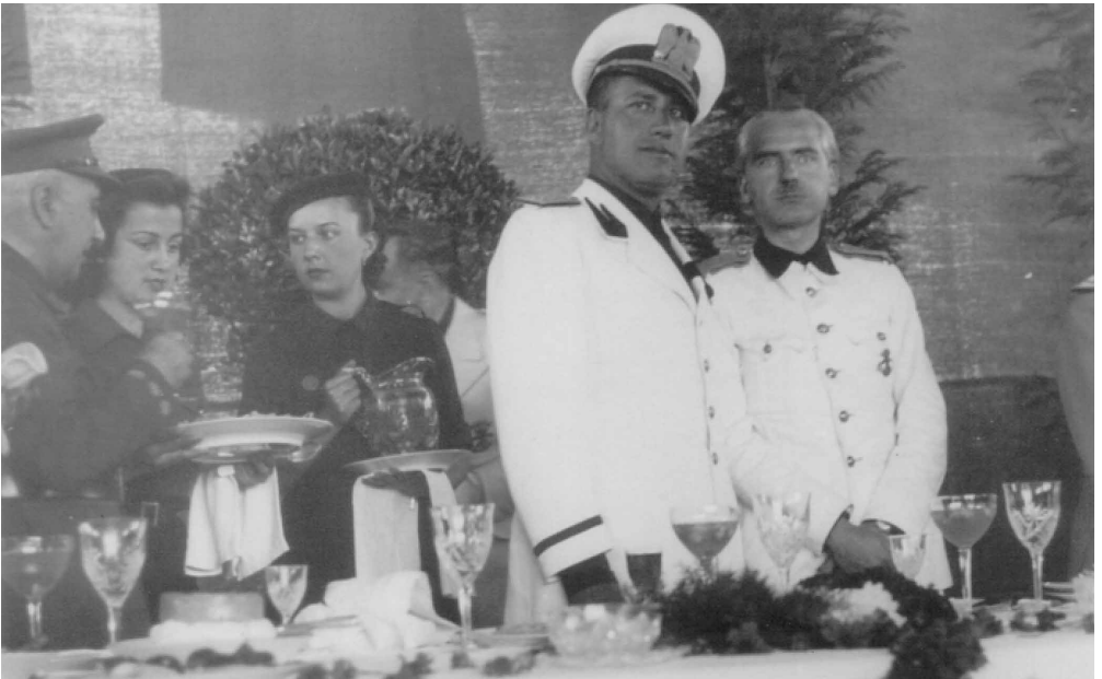
Arriba: 12 de julio de 1939. Apoteósico recibimiento al conde Ciano en San Sebastián adonde llega procedente de Barcelona, acompañado por Serrano Súñer. Escoltado por la Guardia Mora recorre las calles de la capital donostiarra junto al ministro franquista de Asuntos Exteriores y vice-presidente del Gobierno, general conde de Jordana. Abajo: 12 de julio de 1939. A las 10h 30 de la noche, el conde de Jordana ofrece un banquete en el hotel María Cristina de San Sebastián, en honor del conde Ciano. Posteriormente asistirá a una sesión de fuegos artificiales en su honor que contempló desde el Club Náutico.