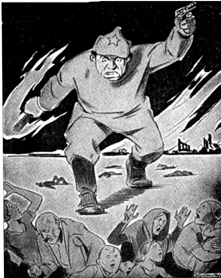
Os traigo el paraíso de la revolución mundial bolchevique.

Ejemplo clásico de la propaganda gráfica anti-comunista de los años 40-50.