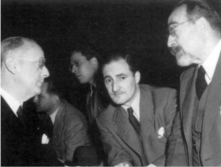
23 de mayo de 1946. El presidente de la República, José Giral, a la izquierda, con el presidente Aguirre y Fernando de los Ríos en el sub-comité de la ONU encargado de preparar el informe sobre la España de Franco.