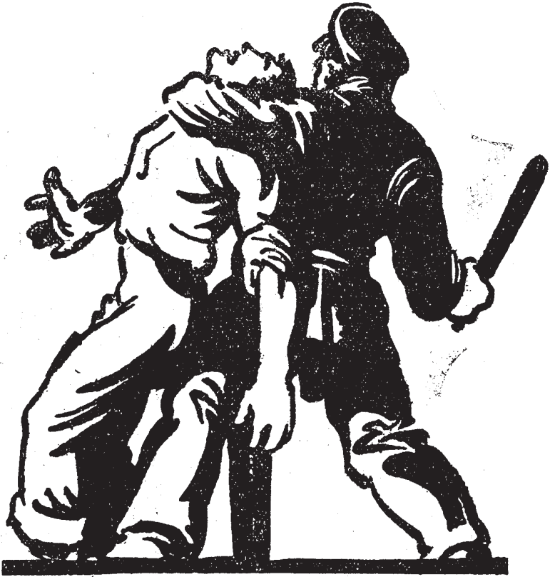
RUTA. Boletín Interior de la F.I.J.L. en Francia. Toulouse, 17 de febrero de 1947.

política, seguida de una fuerte agitación social contra el plan y la presencia norteamericana, en Italia y Francia fundamentalmente, lo que producirá un periodo de tensa desestabilización que terminará con la expulsión de los partidos comunistas de los Gobiernos en los que participan. La réplica lógica será una política similar en los países de Europa bajo dominio soviético con la detención e incluso ejecución, de los dirigentes de los partidos no comunistas y la implantación, mediante diferentes procesos electorales, de Gobiernos firmemente controlados por los comunistas. El comunicado final de la conferencia de fundación de la Kominform, en octubre, expresará claramente esta ruptura definitiva entre los antiguos aliados: “Así pues, se han constituido dos campos: uno, el imperialista y antidemocrático, que se propone como objetivo fundamental establecer el dominio mundial del imperialismo norteamericano y la derrota de la democracia; y el otro, el campo antimperialista y democrático, cuyo objetivo fundamental es socavar el imperialismo, reforzar la democracia y acabar con los restos del fascismo.....Por eso, el campo imperialista y su fuerza motriz, los Estados Uni-