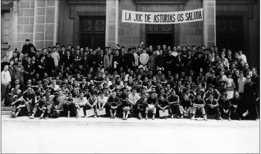
Congreso de Oviedo. 1963. Un puño en alto provocó el cierre durante tres meses del periódico Juventud Obrera .