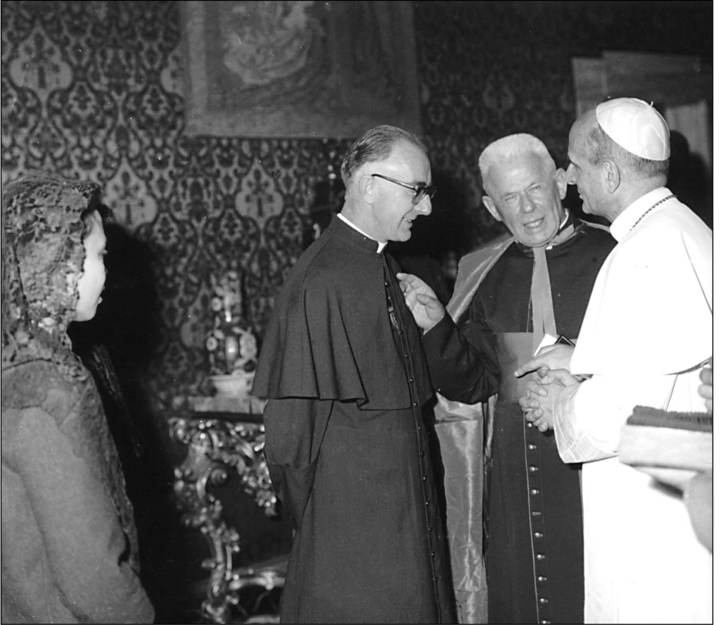
Entrevista de Cardijn y Pablo VI. Hacia 1965.