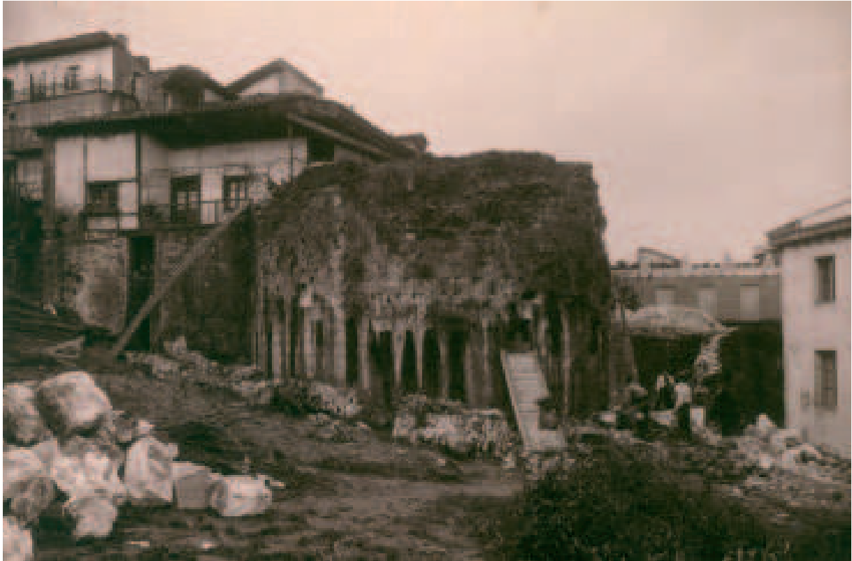
Gotorlekuaren eraiste lanak XX. mende hasieran, Eugenio Figurskik ateratako argazki batean.

“Jesus Hominum Salvator” esaldiaren anagrama osatzen duten “IHS” hizkiak Andre Mari kaleko etxe bateko sarrera-arkuaren klabean. Hiribilduetako bizitza-eraikinetan ikusi dezakegun dekorazio elementuen adibide hau, XV. mende amaieran edo XVI. mende hasieran ugaritzen hasi zen.