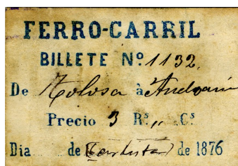
Billetes de viajeros utilizados en el ferrocarril carlista