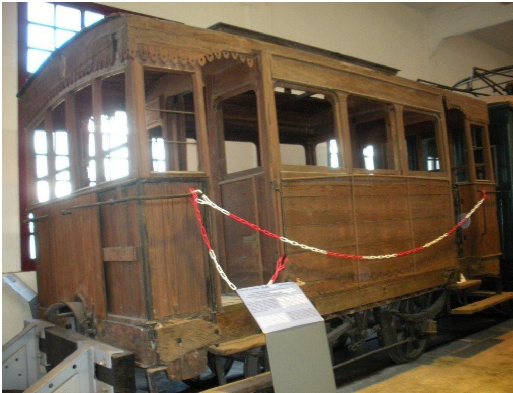
Vagon de 1876 del Ferrocarril de Galdames a Sestao ( Museo Vasco del Ferrocarril, Azpeitia )

Fuerzas carlistas cortaron el puente de Galindo, interrumpiendo por primera vez el tráfico del Ferrocarril de Triano en abril de 1873. Al convertirse la zona en teatro de operaciones militares, la explotación del ferrocarril se suspendió el 16 de septiembre. Los carlistas se hicieron con toda la línea y su material con la toma de Portugaete, durante el sitio de Bilbao. El ferrocarril no volvería a reanudar el transporte de mineral hasta el 14 de febrero de 1876, cuando la guerra había finalizado en aquella zona.