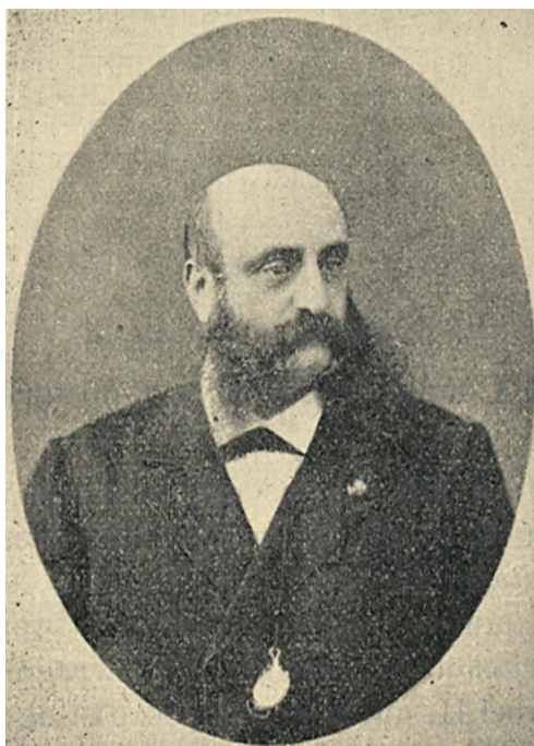
Jose Maria Diego de Leon, Conde de Belascoain

serían necesarios en cualquiera de las dos soluciones contempladas: la recomposición de las vías e instalaciones y la revisión y reparación del material móvil.