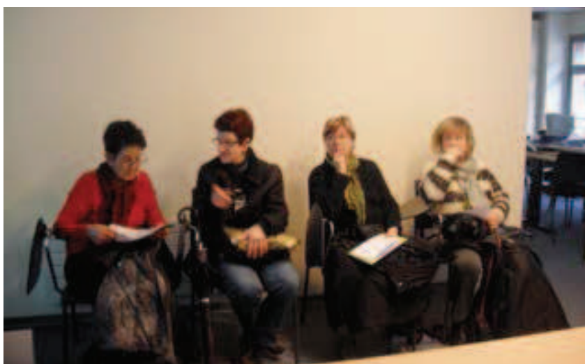
Lantaldearekin saioa. (Argazkiak: Gema Mariezkurrena).