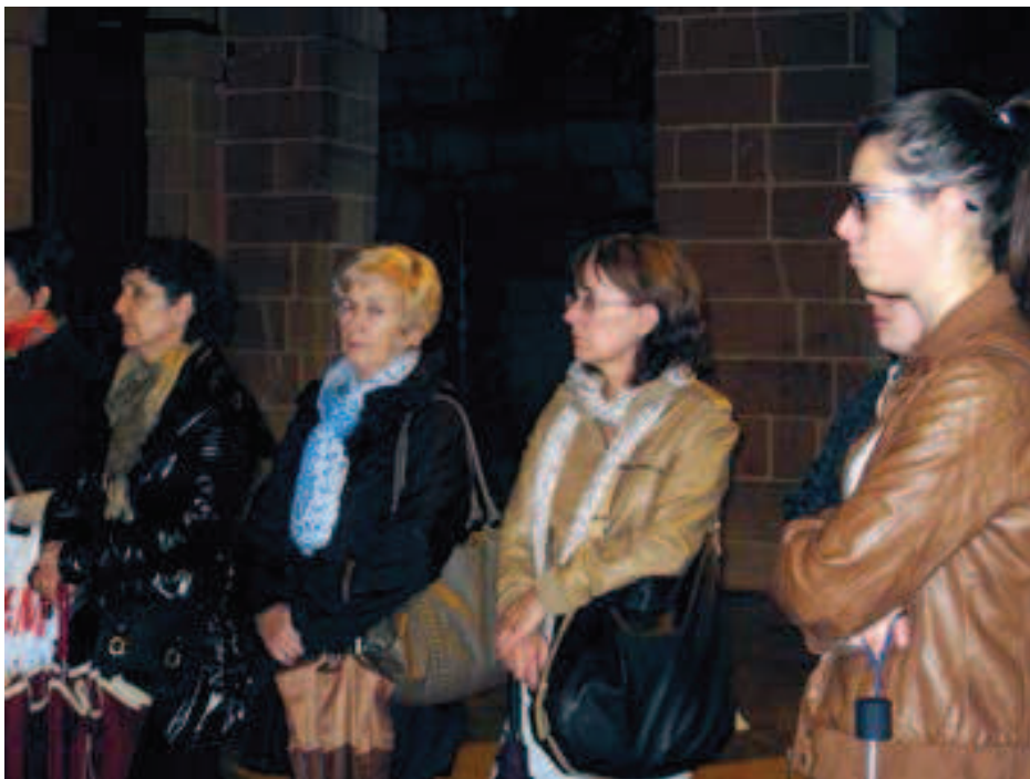
Ibilbidea Errenteria industrialean barrena. (Argazkiak: Luz Maceira Ochoa).

Ibilbidea amaitzean, jarduera bat egin genuen Merkatuzarren, non ikusgai zeuden 1954ko erakusketa industrialaren urteurrena oroitzeko antolatu zuten erakusketako panel batzuk, Udaleko Kultura Sailaren baitakoak.