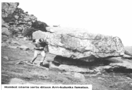
Hainbat istorio sortu dituen Arri-akurra famatua.