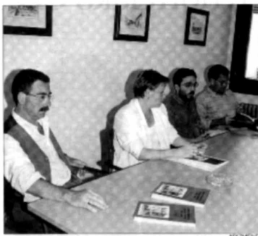
Presentación del libro sobre la Vuelta al Baztan.