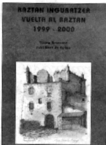
'Vuelta al Baztan'.