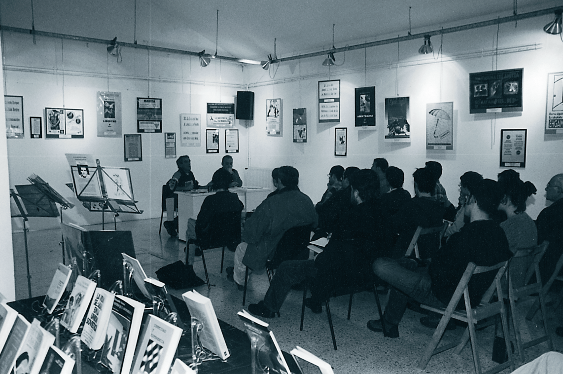
Exposición "EHGAM-Gipuzkoa, 20 urte. Hezkuntza da bidea" en Xepelar Aretoa (2000/02/3-12)