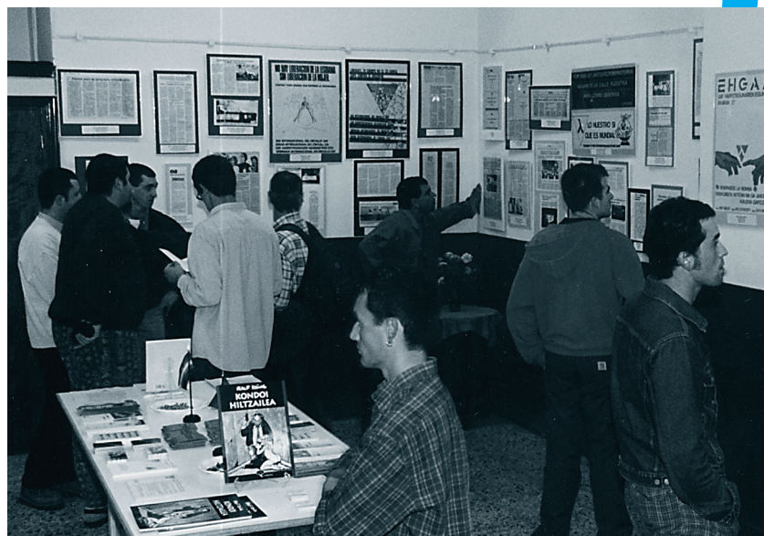
Inauguración de la exposición "EHGAM-Gipuzkoa, 20 urte. Hezkuntza da bidea" en los locales de Txintxarri Elkartea (1999/06/10).

Las reivindicaciones, actividades y propuestas (21 años después) de un grupo de mujeres y hombres con prácticas homosexuales y lésbicas, en su mayoría de nuestro pueblo,