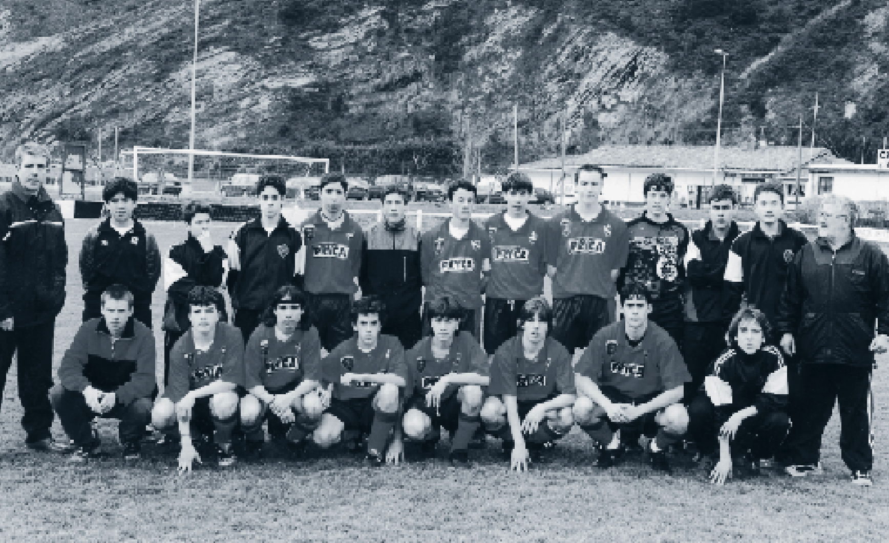
Equipo del "Touring" cadete 2ª. Campeón de Gipuzkoa.

En el trabajo desarrollado para potenciar la base y poder disponer de un vivero de jugadores, se ha conseguido en la escuela de fútbol tener 80 chavales comprendidos entre los 11 y 13 años y en el staf de verano, 60 chavales entre 6 y 13 años. A todo esto hay que sumarle los 185 federados en las distintas categorías.