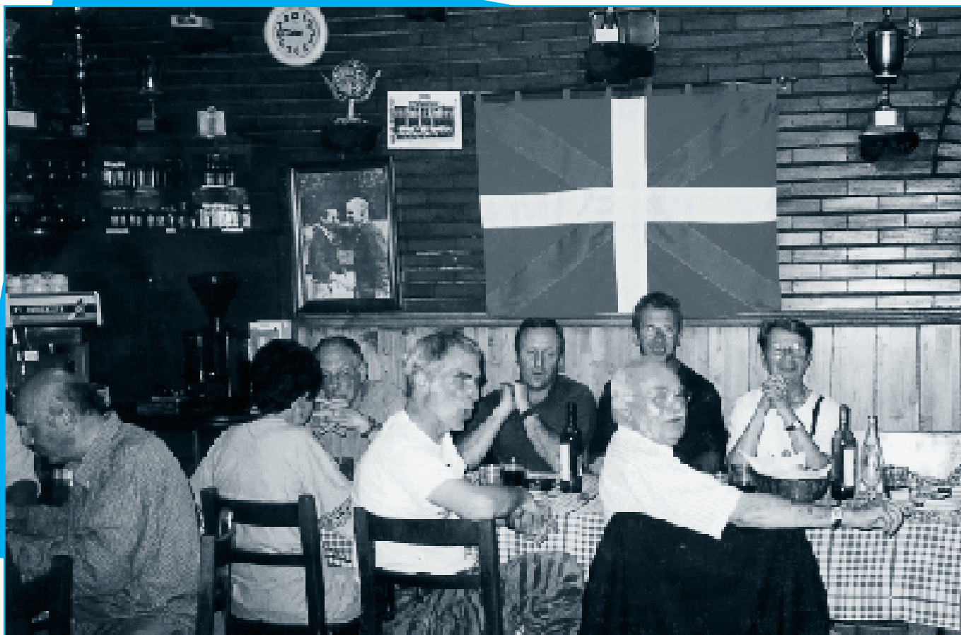
Cena en la Sociedad “Gau-Txori”.