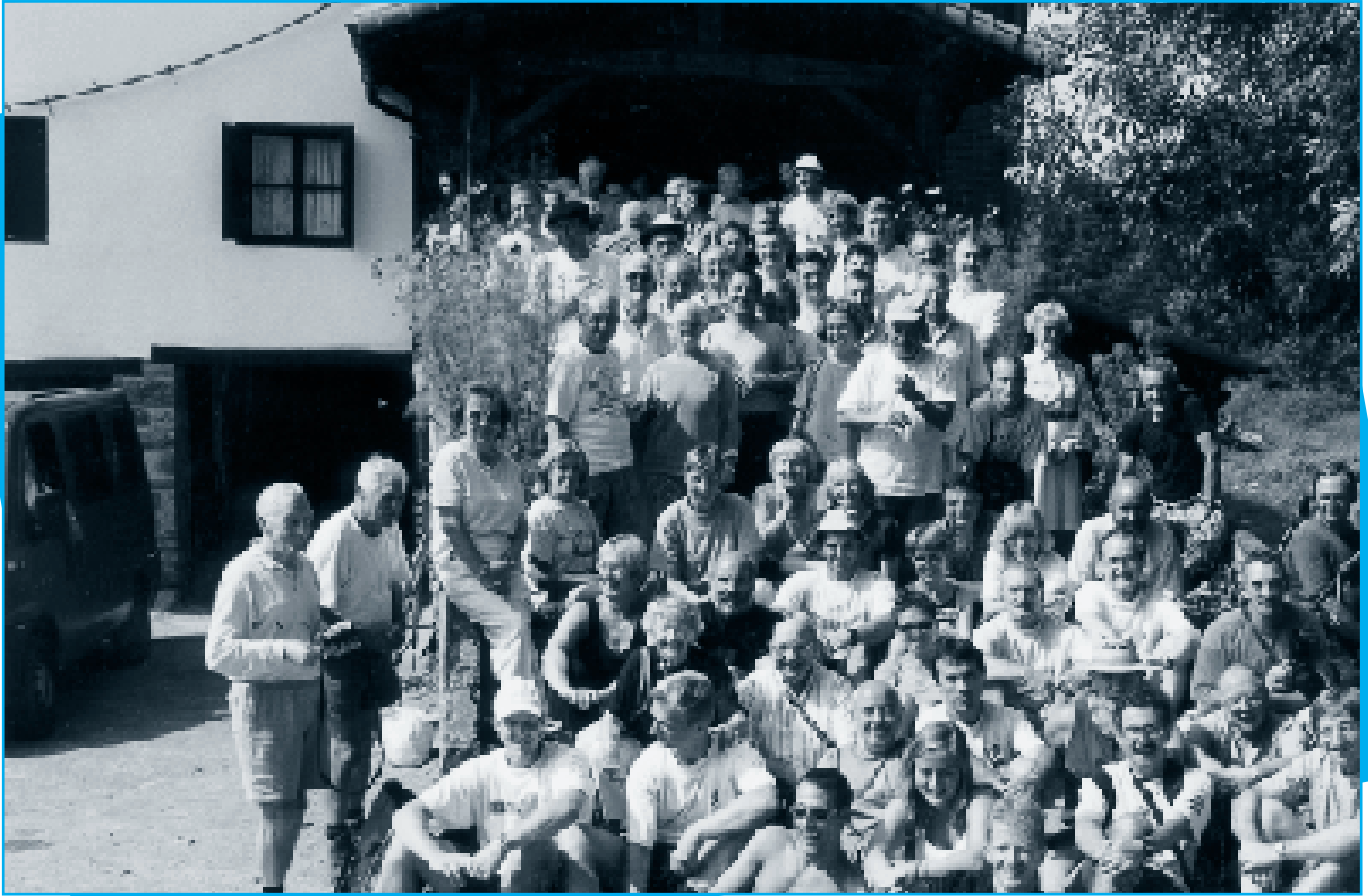
En el Caserío "Sarobe".