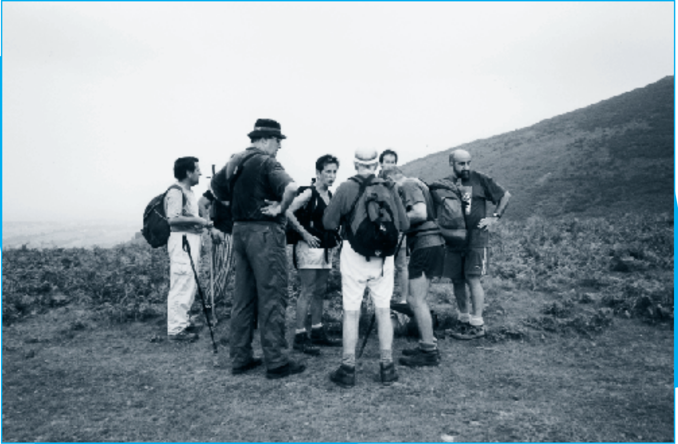
El grupo de "Urdaburu" en Xoldokogagna.