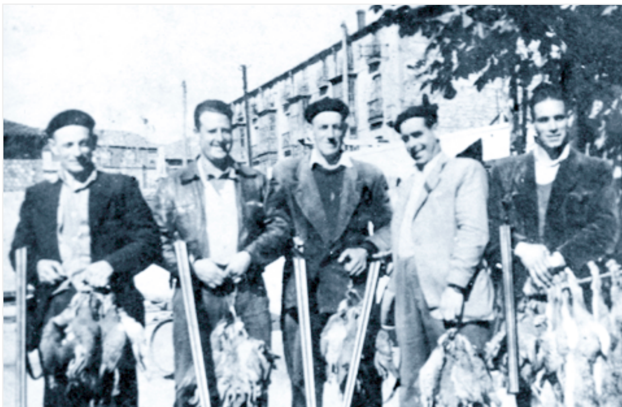
Cuadrilla de caza en la terraza del bar "Mendiola" (hoy bar "Lainhoa").