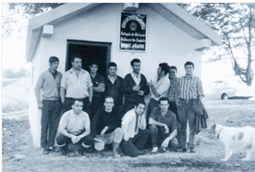
Constructores del refugio de "Malmazar".

Costosa andadura, pero paliada por la dedicación de sus socios, ha sufrido "Txepetxa" hasta llegar a emplazarse en la calle Orereta.