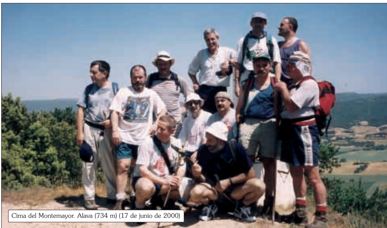
Cima del Montemayor. Alava (734 m) (17 de junio de 2000)