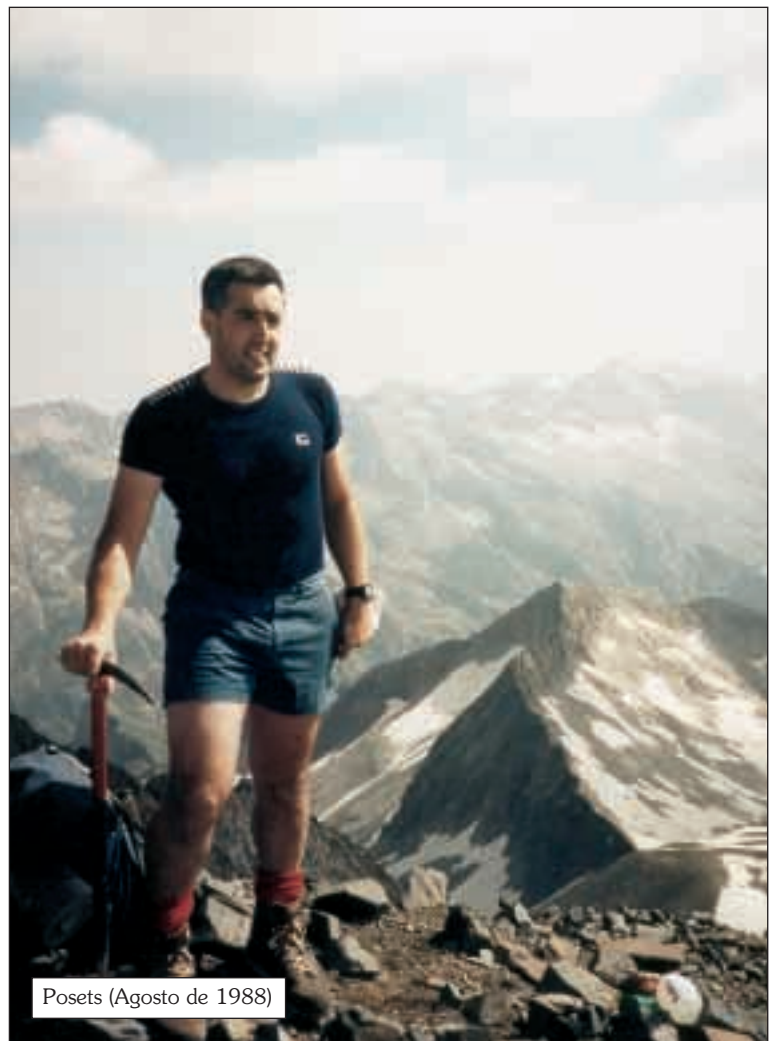
Posets (Agosto de 1988)