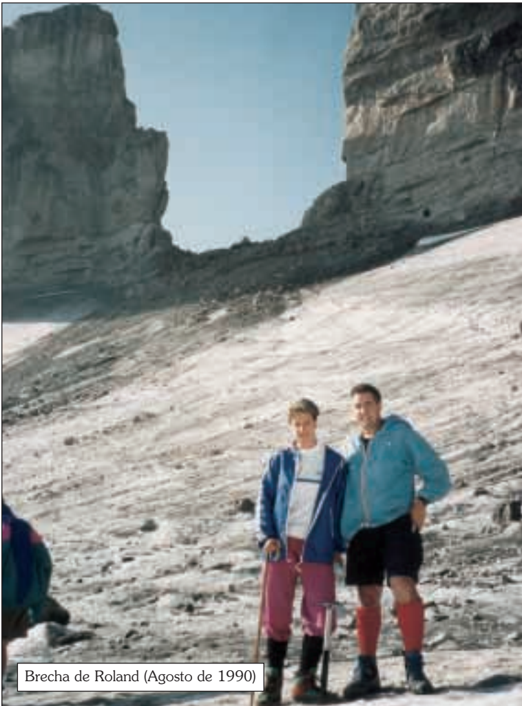
Brecha de Roland (Agosto de 1990)