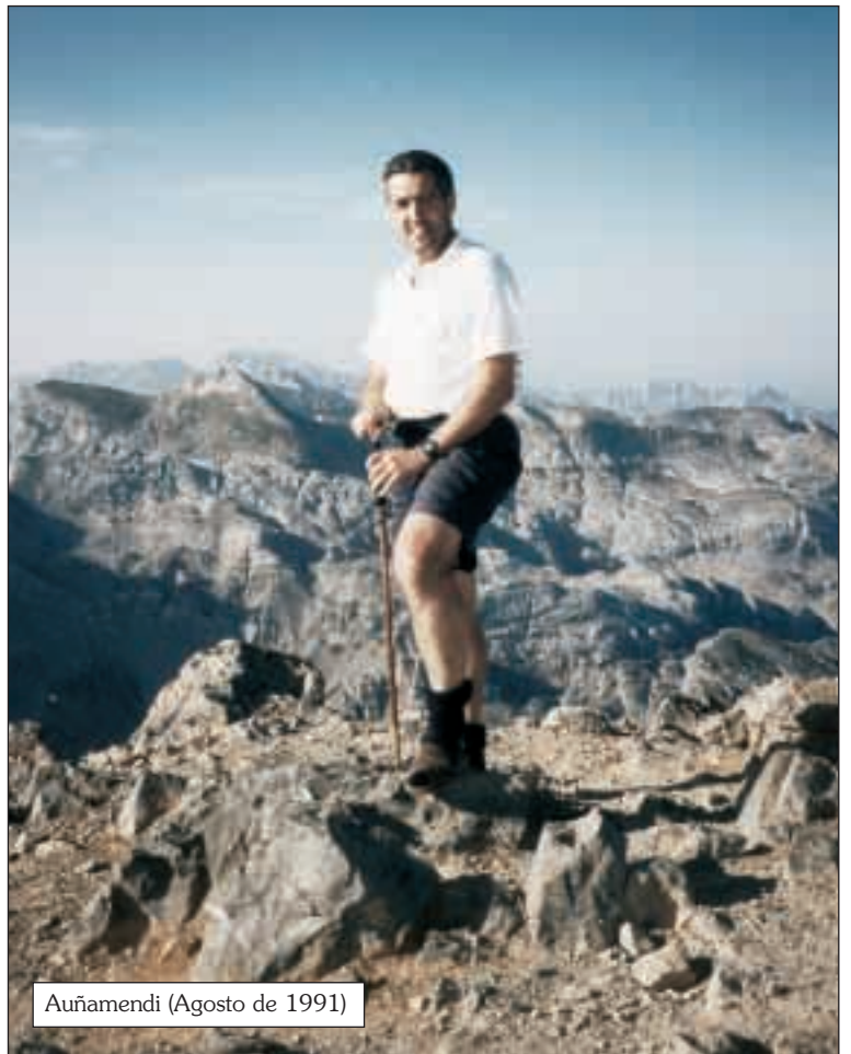
Añamendi (Agosto de 1991)

Ibilaldiaren amaieran, itxiera ekitaldia: berriz ere otoruntza. Ibilaldiko unerik politenetarikoak, dudarik gabe. Lagun guztiok mahai baten inguruan esertzen ginen. Ahal izanez gero tabernan, bestela ahal genuen tokian (pilota-lekuan, eliza bateko aterpean, balkoi baten azpian edota erreka baten ondoan) eta ahal bezala (lurrean eserita edo zutik). Gosarian bezalatsu, hogeit hamar lagun biltzen ginen –pentsaera eta jatorri diferentekoak guztiok–. Agape hartan nork bere janariak eta edariak ateratzen zituen motxi-