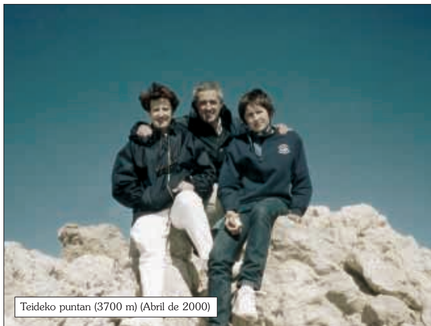
Teideko puntan (3700 m) (Abril de 2000)