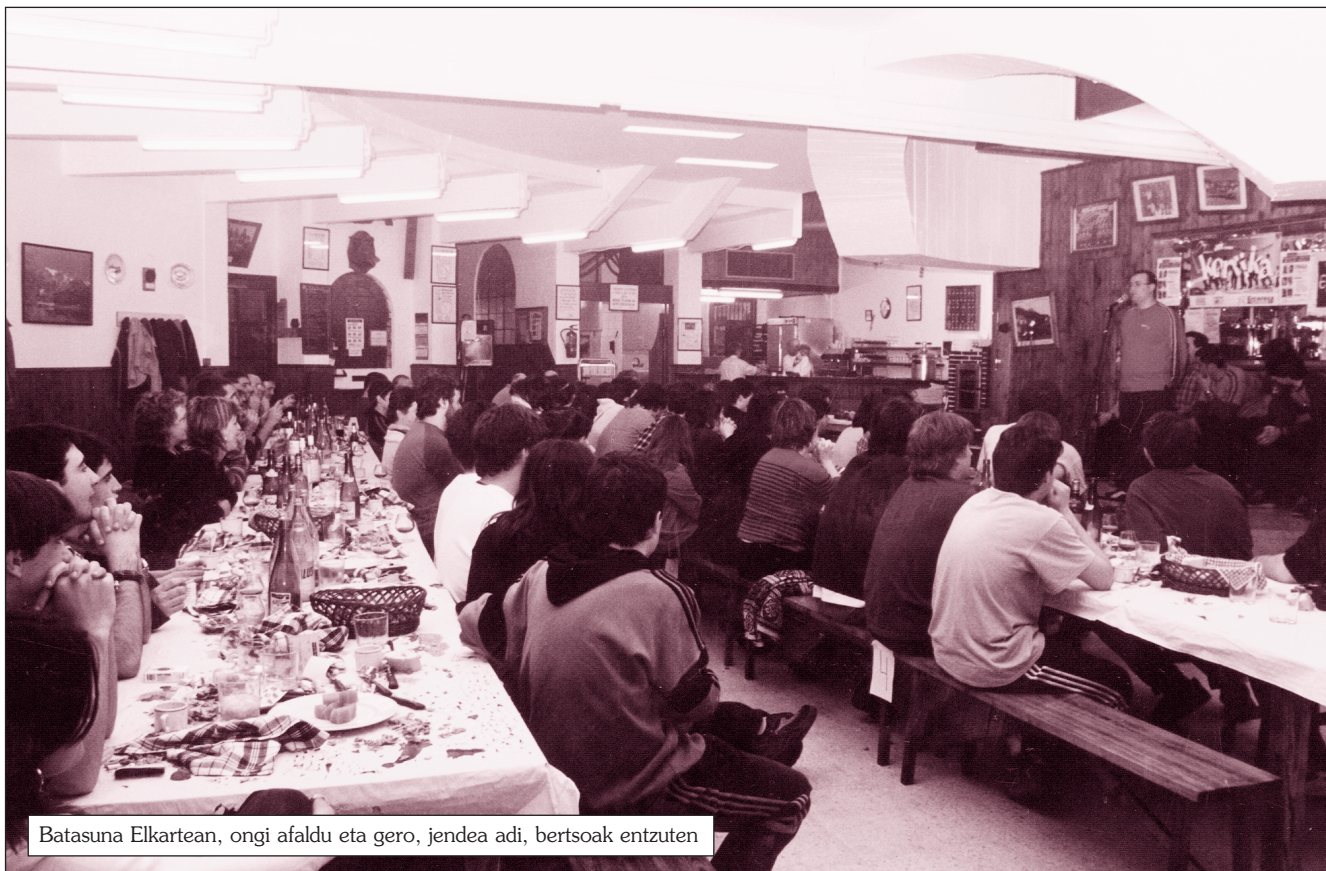
Batasuna Elkartean, ongi afaldu eta gero, jendea adi, bertsoak entzuten