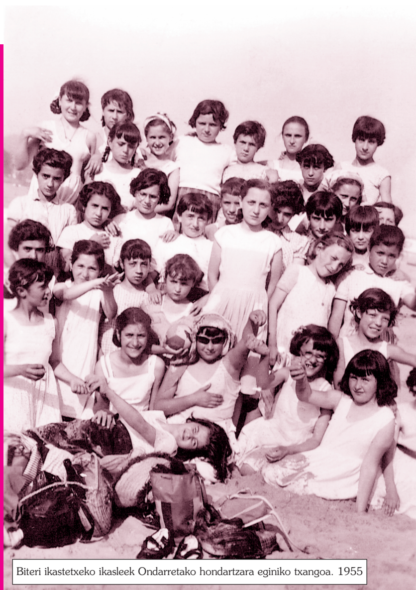
Biteri ikastetxeko ikasleek Ondarretako hondartzara eginiko txangoa. 1955

Bere historiaren oroigarri gisa balio dezaten ondorengo kontakizun hauek.