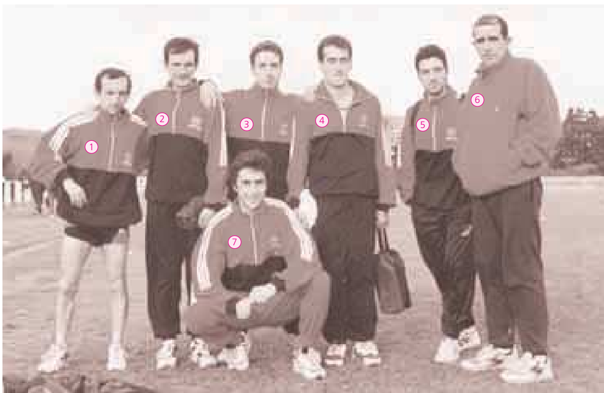
Campeonato de Cross, equipo senior, Lasarte 1996.