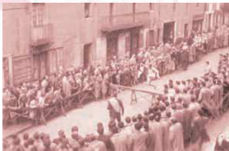
9 de marzo de 1958

II Cross del CAR y I Memorial Pacho Egurrola