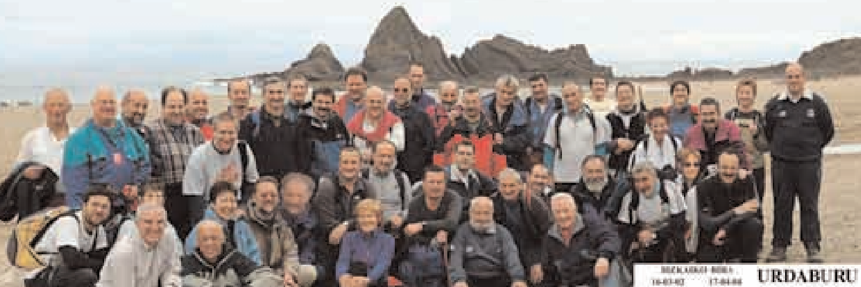
Bizkaiko bira 16/03/02-17/04/04. Saturrarán (Ondárroa). Final de la Vuelta a Bizkaia.

territorios de Gipuzkoa, Araba y Bizkaia. La marcha continúa con la vista puesta en la esbelta figura de Udalatx. Si preciosa resulta su ascensión, otro tanto ocurre con su vertiginoso descenso hasta el puerto de Kanpazar. La etapa de febrero tiene como punto final el pueblo de Ermua. La travesía sigue la línea del cordal marcado en tierra por los postes del gasoducto y en el aire por el tendido eléctrico, aunque en esta ocasión disfrutamos de una gran marcha invernal, con nieve en más de la mitad del recorrido. En primer lugar se asciende a la cumbre de Intxorta y posteriormente a la de Erdella, para ir perdiendo altura hasta alcanzar el precioso entorno de la presa de Aixola y seguidamente llegar al casco urbano de Ermua.