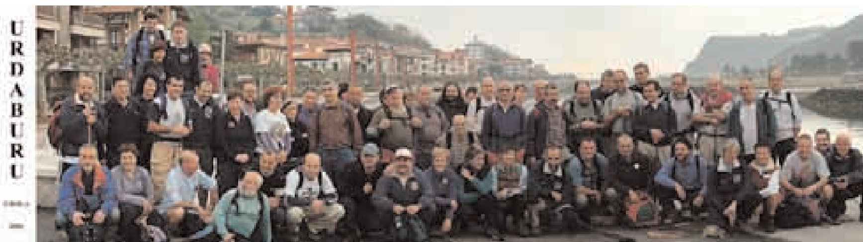
Urola 2004 – Zumaia. Inicio de la vuelta al valle del Urola. 15 de mayo de 2004.

Concluida la "Vuelta a Bizkaia", en mayo ya está en marcha un nuevo proyecto que tiene como eje el río Urola. El pasado 15 de mayo salíamos de Zumaia con la vista puesta en el macizo de Izarraitz. Tras un hermoso paseo costero entre prados y caseríos, con el mar siempre a la vista, llegamos al barrio de Elorriaga, ya en Deba, y nos fuimos acercando al macizo calizo de Andutz. Cruzamos la carretera