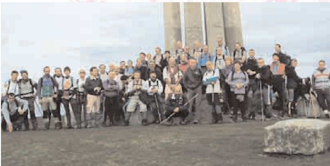
Besaide. Etapa 21 – Vuelta a Bizkaia. 17 de enero de 2004.

Tras el paréntesis veraniego, en septiembre abordamos uno de los macizos míticos para los vizcainos, el de Ganekogorta, otro de los montes llamados “bocineros” porque desde él se llamaba a Juntas Generales. De nuevo, el laberinto que conforman las pistas abiertas para la repoblación es uno de los factores que nos traen a mal traer a los montañeros. Al inicio de la marcha, en la aproxima-