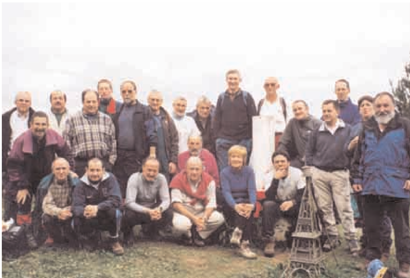
Cumbre de Tontorramendi (386 m.). Etapas 24 – Vuelta a Bizkaia. Día 17 de abril de 2004.