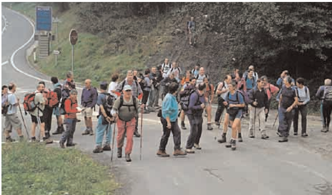
Camino de Aitzeta. Etapa 18 – Vuelta a Bizkaia 18 de octubre de 2003.

En las últimas etapas veníamos caminando por la muga de Bizkaia con Araba. A partir de ahora, lo haremos siguiendo la divisoria con Gipuzkoa hasta su terminación. Iniciamos 2.004 en el barrio de Gantzaga, de Aramaiona, para elevarnos a la cumbre del Tellamendi y continuar el cordal hasta Besaide, emblemático lugar porque en él se alza el monumento al montañismo vasco, en el punto de encuentro de los