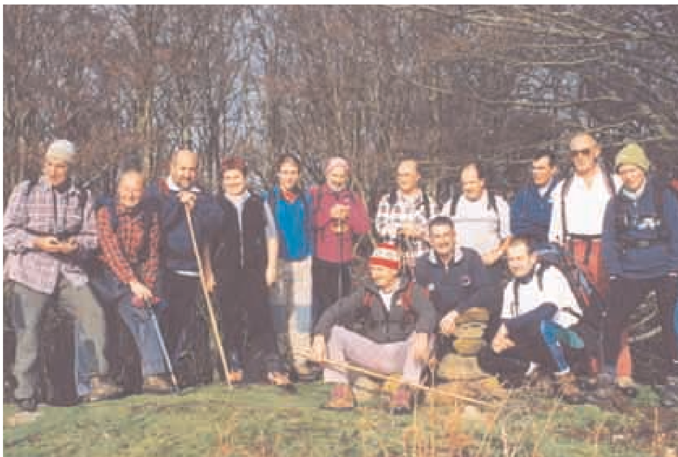
Vuelta a Bizkaia. Etapa 20 Motxotegi (817 m.). Día 20 de diciembre de 2003