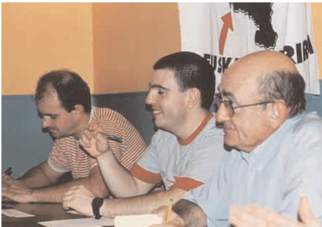
Epaile taldea, belaunaldi desberdinetako partaideek osaturikoa. Ez zuten lan erraza izan.