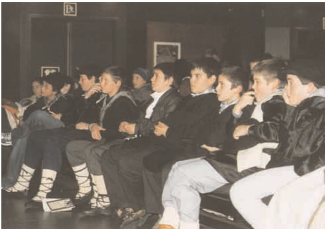
Xenpelar Bertso Eskolako gaztetxoak, adi. Noiz izango da gure txanda?