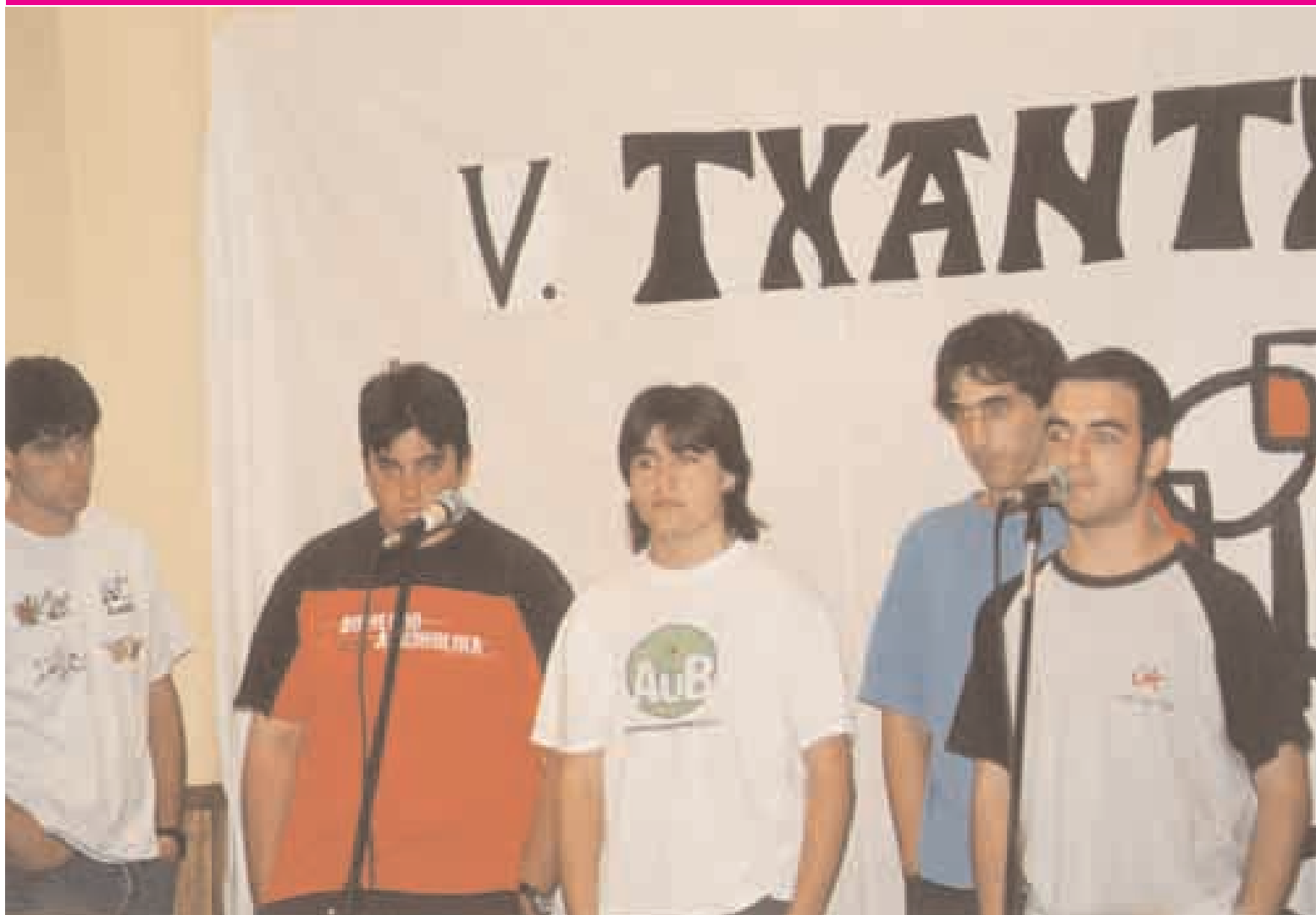
Kanporaketa saioa, Landare Elkartean.