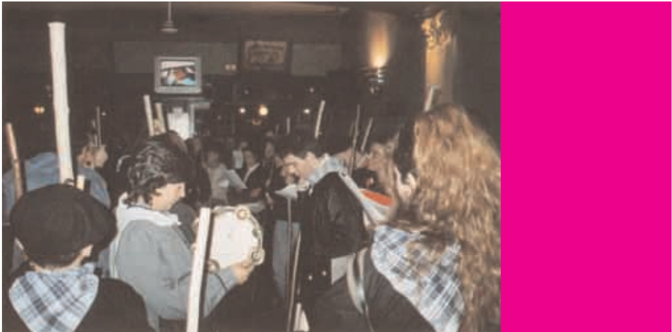
Santa Ageda bezperan koplak kantatzen.