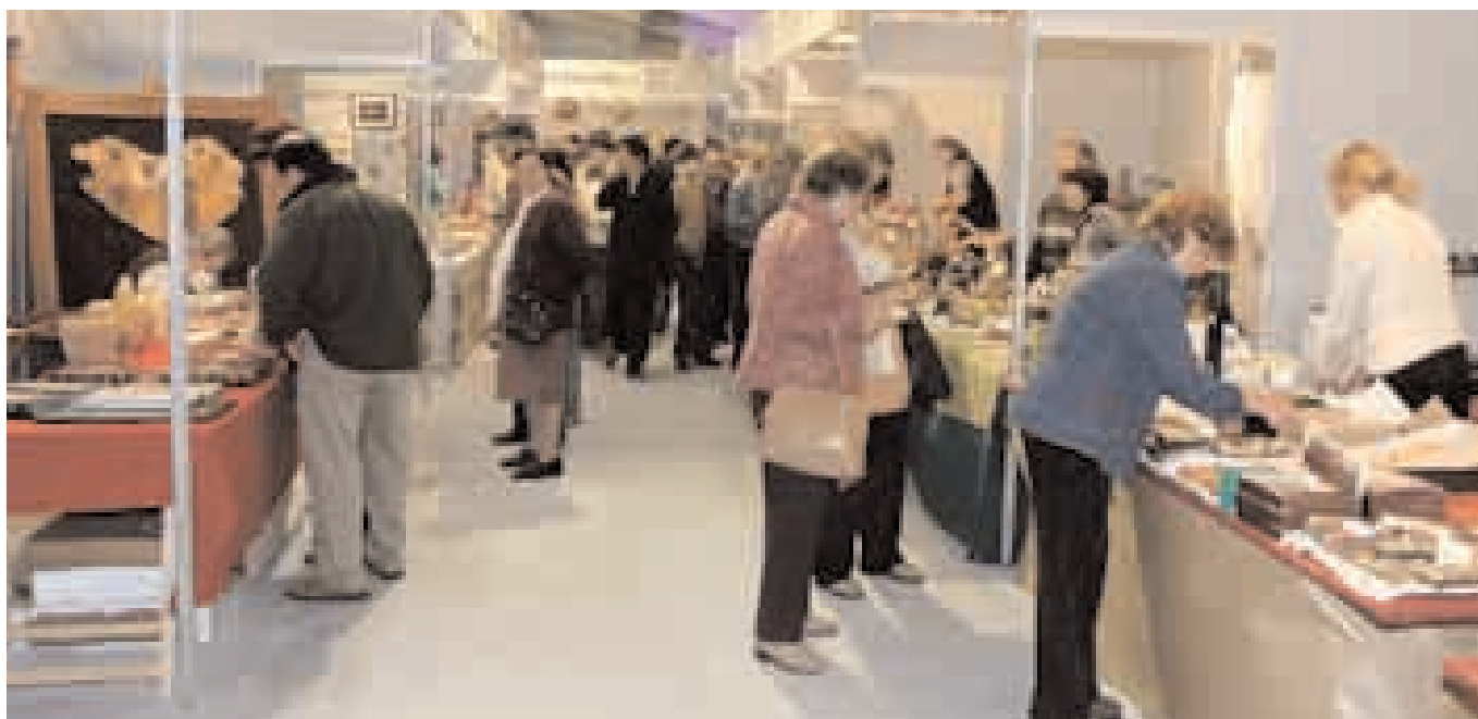
Azokaren ikuspegi orokor bat.

Azkenik, ospatu berri dugun XXVI. Euskal Herriko Eskulangintza Azoka aurrera eramatea posible egin duten guztiei eskerrak eman nahi dizkiegu. Lehenik eta behin, parte hartu duten artisau guztiei. Eskerrak ere, etorritako ikusleagoari, hala nola bere lana eta ardura jarri duten komunikabide eta beste zenbait zerbitzuei; eta nola ez, etorritako Aginteriei, eta bere laguntza eta babesa urtero ematen diguten Erakundeei: Gipuzkoako Foru Aldundia, Errenteriako Udala eta Gipuzkoa-Donostia Kutxa. Bihoakie berriro guztiei gure eskerrik beroena.