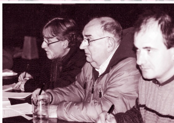
Epailleak adi. Ez zuten lan erraza izan