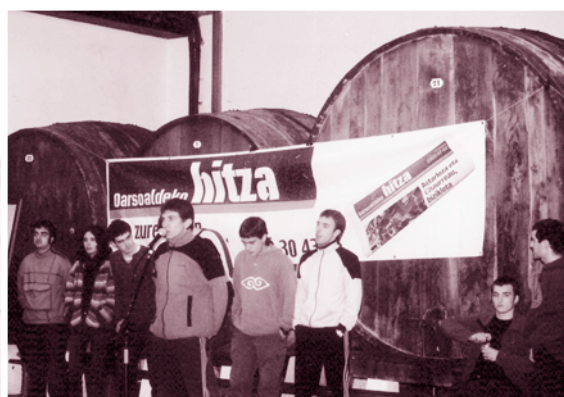
Leku berean, beste taldeko bertsolariek finalerako txartela lortu nahian