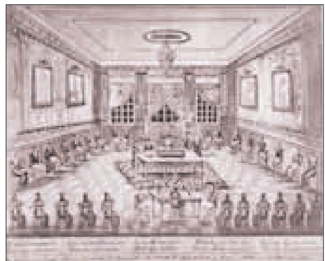
Dibujo atribuido a Juan Crisóstomo de Arriaga