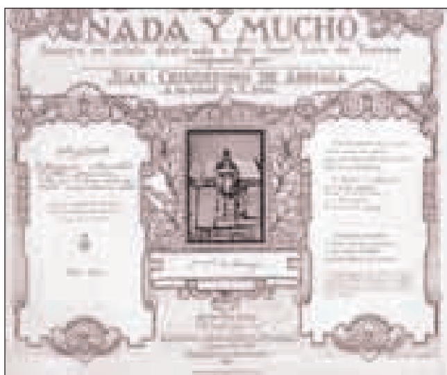
Portada de partitura diseñada por Aurelio Arteta

Ahora bien, ¿cuándo se conoció la música de Mozart en el País Vasco? Responder eficazmente a esta pregunta tardaría bastantes años y trabajos diversos, por lo que nos tendremos que contentar con aportar algunos datos. El antiguo archivo musical de Arantzazu, que data de antes de 1834, conserva copias de principios del siglo XIX (recordemos que Mozart fallece en 1791) de varias obras de Mozart, una Misa a 4 (la correspondiente a K.192, compuesta en 1773), un terceto de fítilo "Mandina amabile" (K.480, compuesta en 1785), un Aria, de fítilo "Vendromi in torno", dos Rondós copiados en un cuaderno de 1820, para tecla, cinco variaciones para órgano, copiadas también a comienzos del s. XIX y una adaptación de un fragmento de las Bodas de Fígaro para dos clarinetes y bajón.