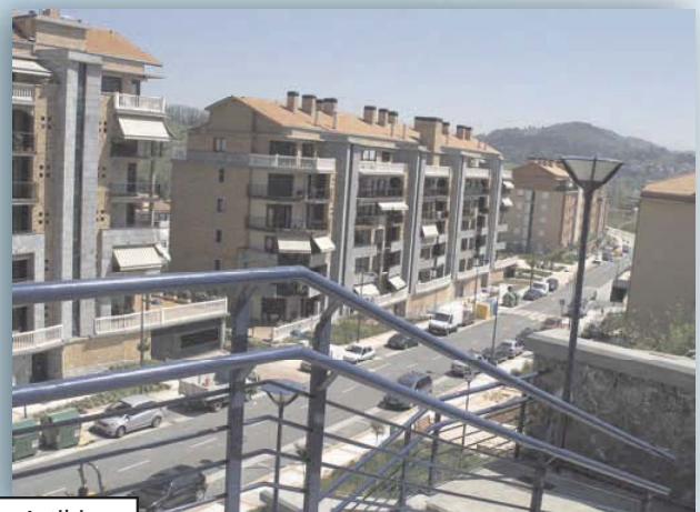
Calle Ramón Astibia