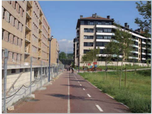
Viviendas en el antiguo campo de fútbol de Larzábal