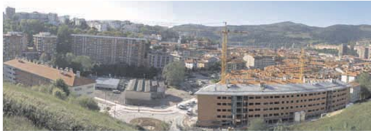
Nuevas casas de "Pekín" desde Arramendi. Abajo irá la Glorieta de Cataluña, detrás el Parque José Miguel Barandiaran