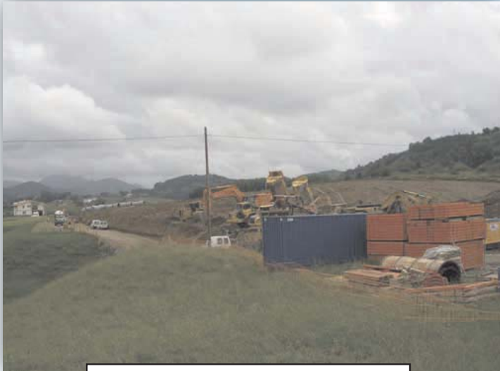
Al paso cerca de la Glorieta de Murcia (Ikastola, Zamalbide, Egiburuberri)