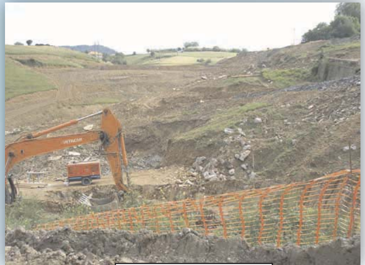
Vista desde la canalización * * * Y todavía falta la Y (TAV)