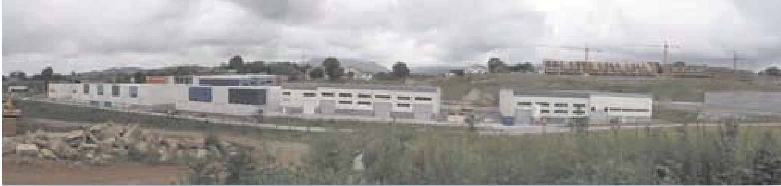
Nuevo polígono industrial de Egiburuberry y casas cerca de Sagardiburu