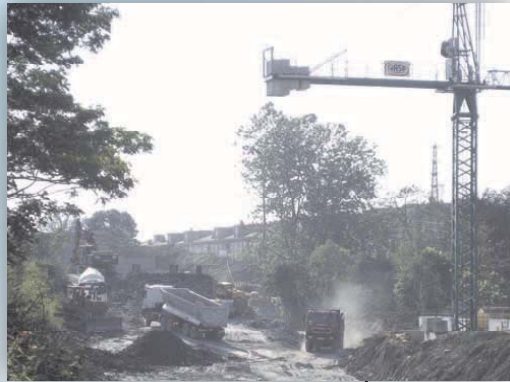
Principio del Paseo Jorge Oteiza