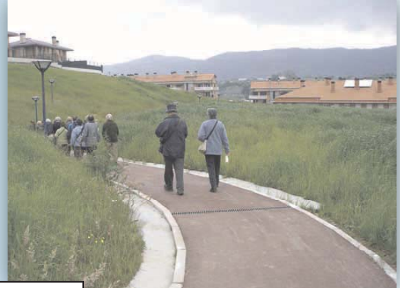
Parque Eduardo Chillida