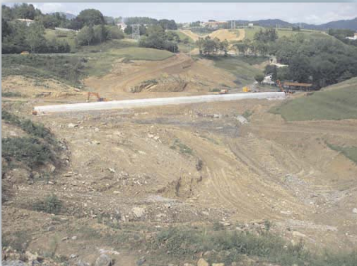
Abajo a la derecha de la canalización está el caserío Tellegiñeta. Arriba el desmonte, no lejos de Zamalbide