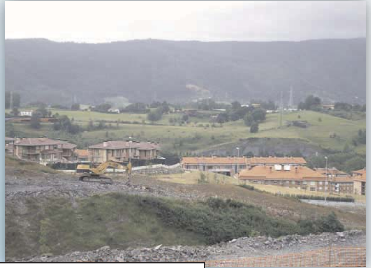
A los dos lados de la autopista se iniciará el Segundo Cinturón * * * Errenteria es uno de los municipios más castigados en estas necesarias obras