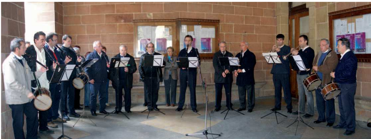
Los txistularis veteranos de "Ereintza"