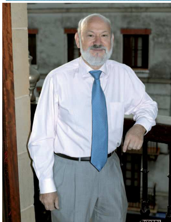
Alcalde de la Villa Juan Carlos Merino (PSE-EE)