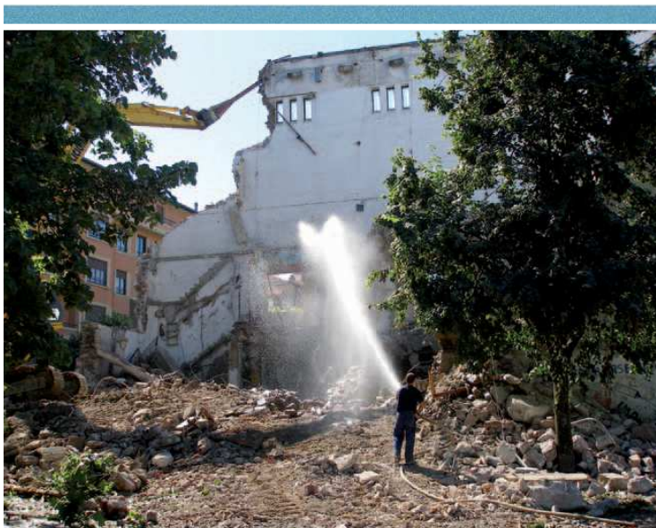
14 de junio: Derribo del batzoki .

La orquesta sinfónica de Errenteria, junto con el coro "Aita Donosti", actuó en la iglesia de los Capuchinos de San Sebastián.