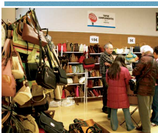
"Feria del Stock" en la Sala "José Luis Caso"