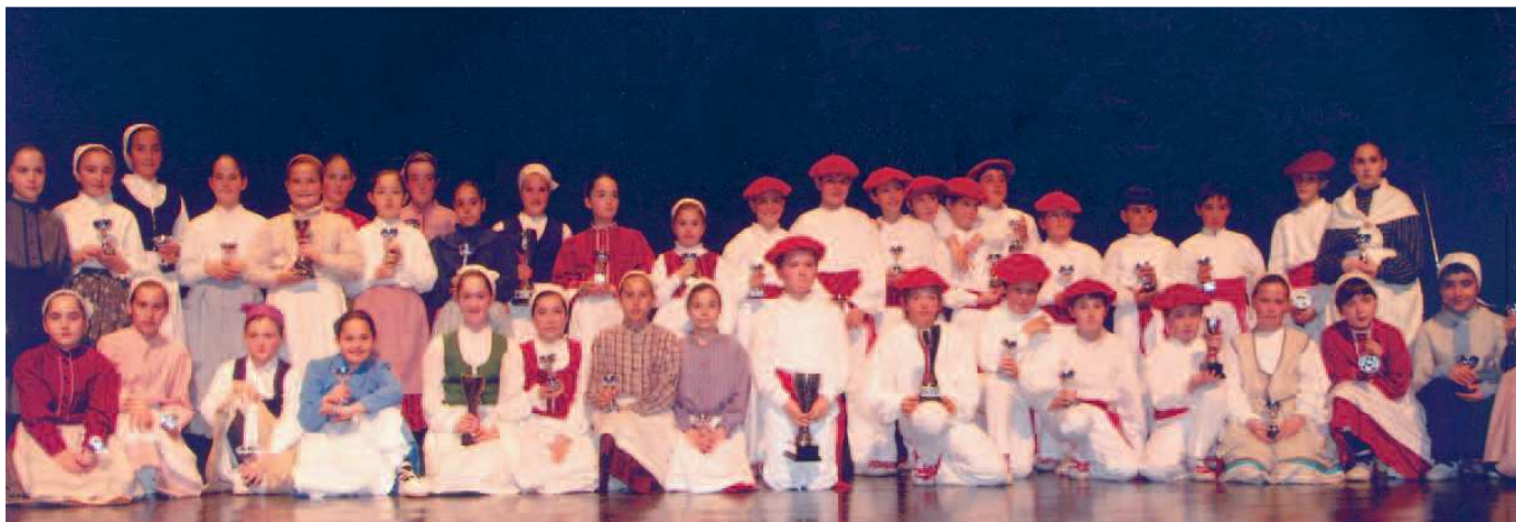
Fotografía de los dantzaris en Beasain

El joven dantzari errenteriano venció en la 17ª edición del certamen de aurreku celebrado en Beasain.