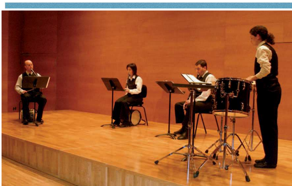
Actuación de la Banda Municipal de Txistularis