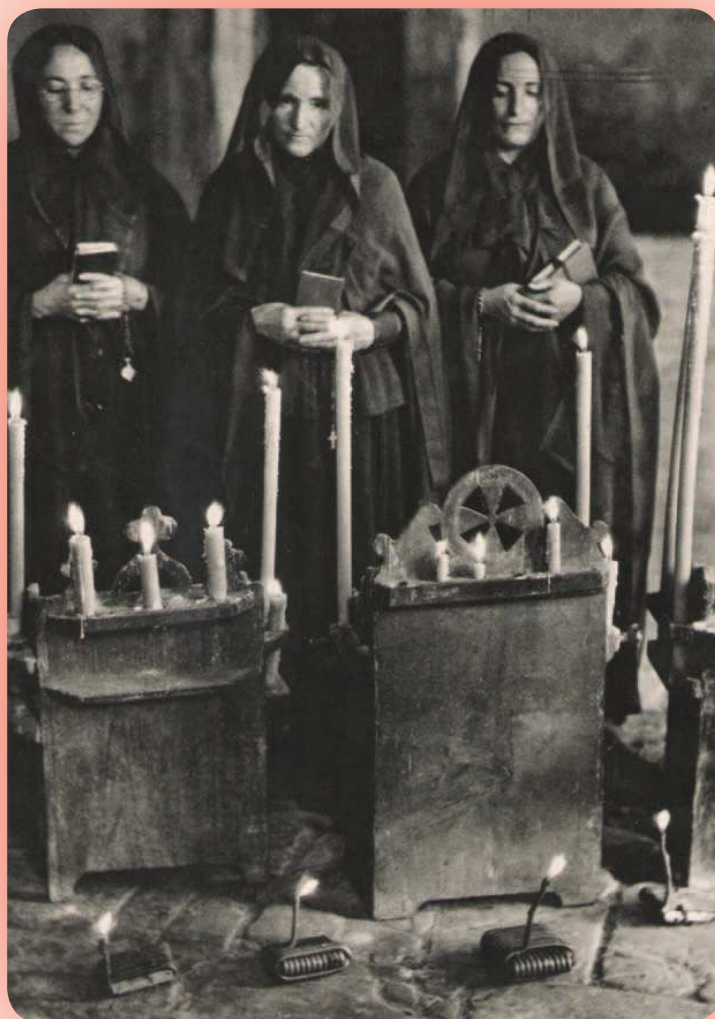
Berastegiko emakume elizkoiak.

moduan, Hegoaldean hilerri berriak elizetatik aparte egin ziren. Hala ere eta XX. mendeko hirurogeigarren hamarkada arte, elizetan hauen oin osoa hartzen zuten bankuak zabaldu ziren arte, etxeek gorde zituzten jarlekuak, hots hilobi sinbolikoa, eta bertan gauzaten ziren hileta dolu eta oro har arbasoen inguruko eginkizun sinbolikoak. Eliz barruko hilobi sinbolikoen galera lehenago gauzatu zen hirietan herrietan baino eta oro har aldaketa horrek hilerriko hilobiari pasa zion sinbolismoa. Neronek, eta laster mende erdia beteko dut, ez ditut ezagutu ohitura horiek eta aldiz betidanik kanposantuko hilobien inguruko ohiturak eta hauek ere biziki aldatu dira azken urte hauetan. Aldaketak, aldaketa, eta edozein kasutan, bi argazki hauek aukera eskaini digute izan zen eta jada ez den mundu bati begirada emateko. ■