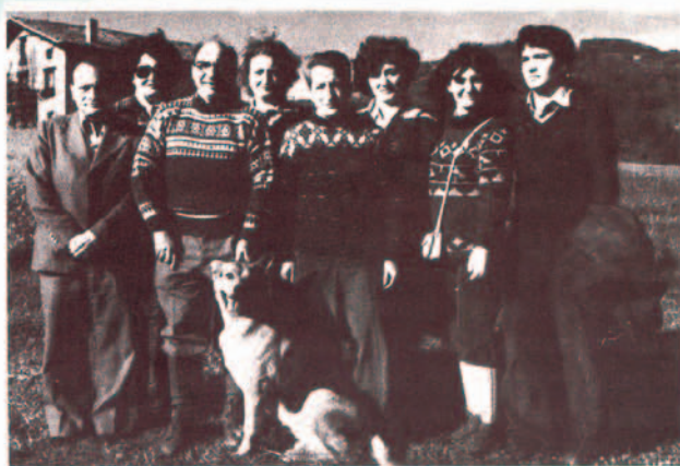
Los hermanos Hospitaler, con algunos familiares.

Noticia publicada en UNIRAMA, revista del Personal de Unión Explosivos Río Tinto S.A., en el número de la primavera de 1979.