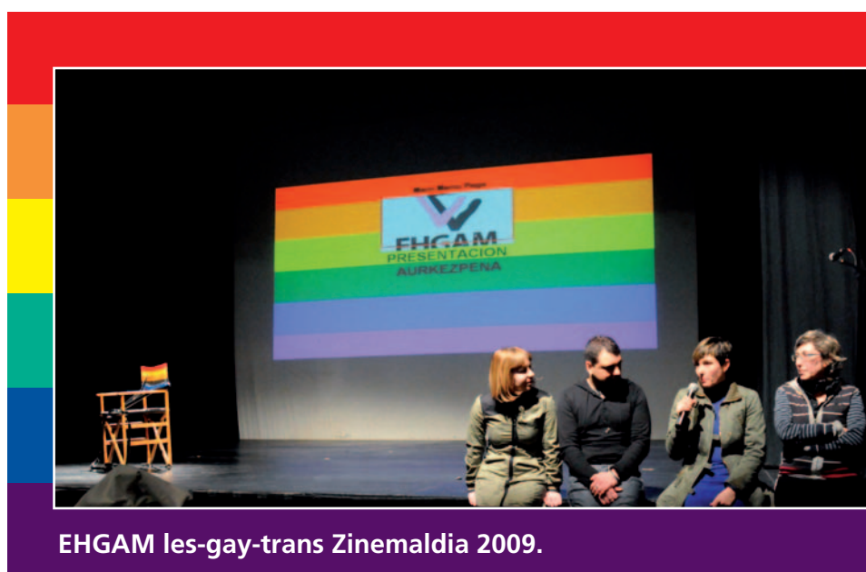
EHGAM les-gay-trans Zinemaldia 2009.

Seguiremos informando, de cualquier manera, de la necesidad de mantener relaciones sexuales seguras, de la importancia de la prevención y de la realización regular de la prueba del VIH, así como de no culpabilizar por ello y combatir la sidafofia . En la convicción de garantizar que entre todos y todas poco a poco conseguiremos frenar la pandemia del VIH y del SIDA.