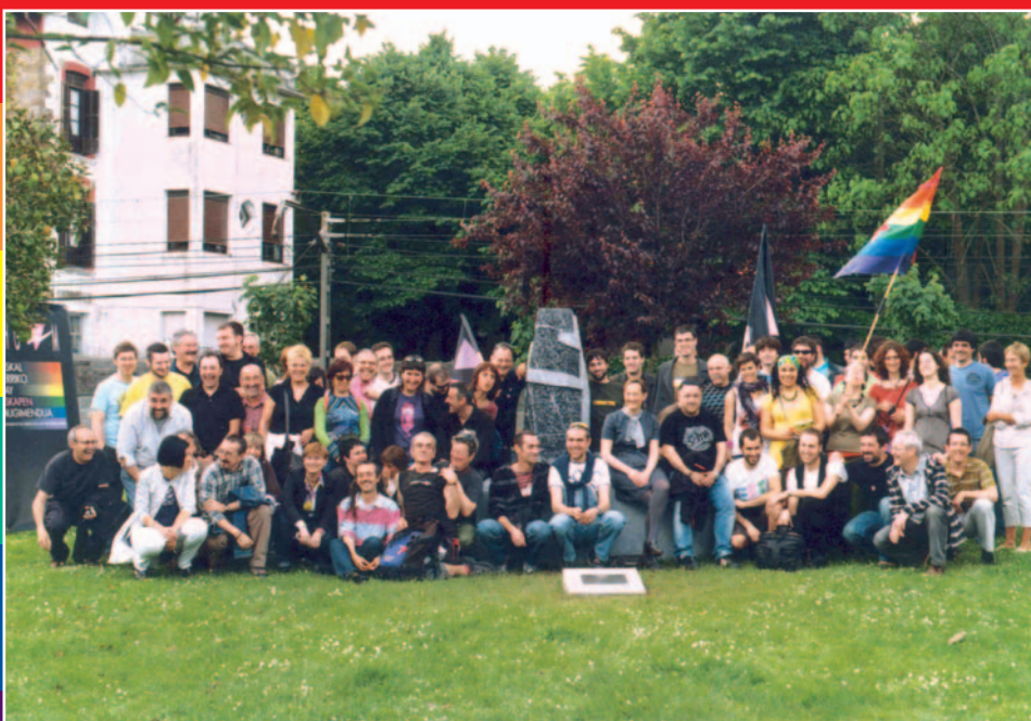
Durango, 16 de mayo de 2009. Inauguración de un monumento a las "otras" víctimas. "Kantu Ixila".

Por otro lado, después de haber realizado durante varios años la "gay.les.trans acampada" en el albergue Arritxulo (Oiartzun), otra de las actividades que más gente atrae y que consiste en pasar un fin de semana en un espacio libre de humos y luces de neón en un espacio libre de homo, lesbo y transfobia, este año nos tras-