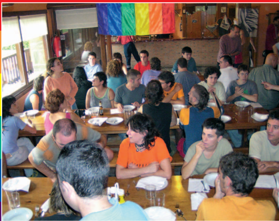
Acampada gay-les en Arritxulo (Oiartzun).

Hemos dicho que la jornada tuvo lugar el 16 de mayo, fecha que no fue elegida al azar, sino por ser el sábado más próximo al 17 de mayo, el Día Internacional contra la Homofobia, en el que se conmemora el día en el que la OMS (Organización Mundial de la Salud) decidió quitar del listado de enfermedades la homosexualidad, en el año 1990.