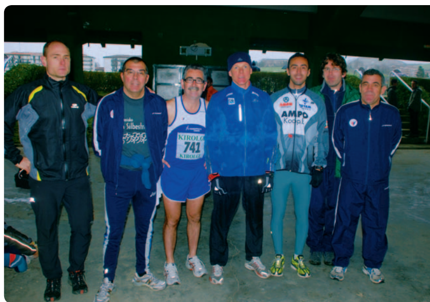
Día 25 de enero de 2009, Cross Internacional de San Sebastián. Componentes del Club Atlético Rentería con Sergei Lebid, ocho veces campeón de Europa de cross.

↳ Alberto Txakon fue tercero en la categoría de populares en el Cross de San Sebastián.