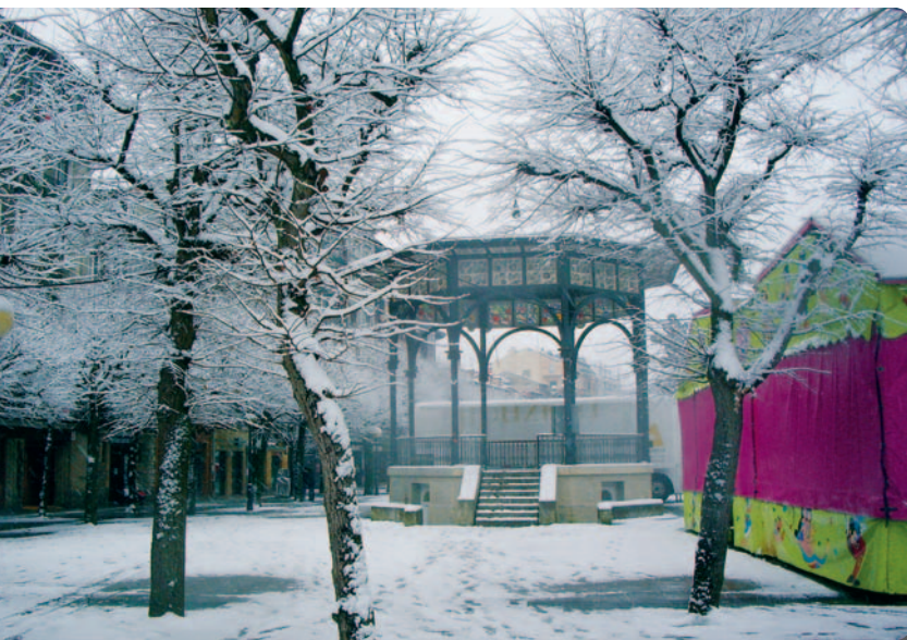
Nevadas en Errenteria.