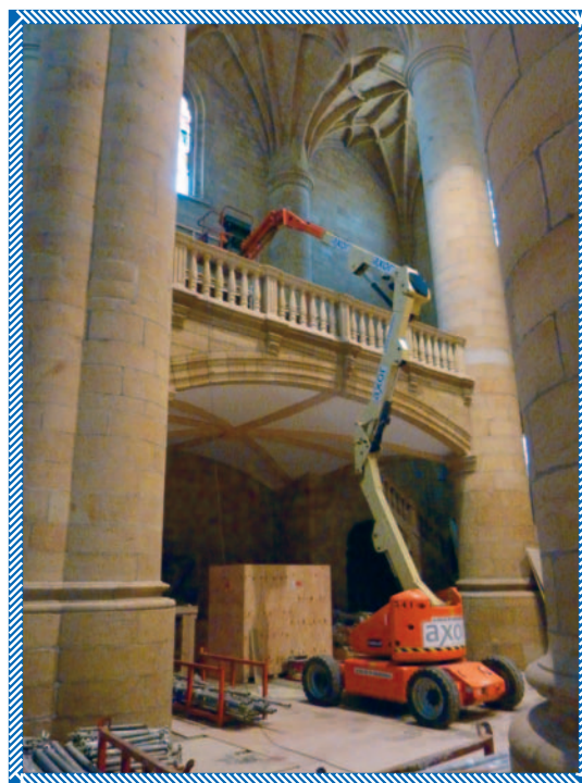
4 de mayo de 2009: Momento de la descarga de las piezas y colocación del órgano de la parroquia.