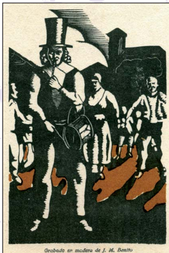
Grabado en madera de J. M. Benito