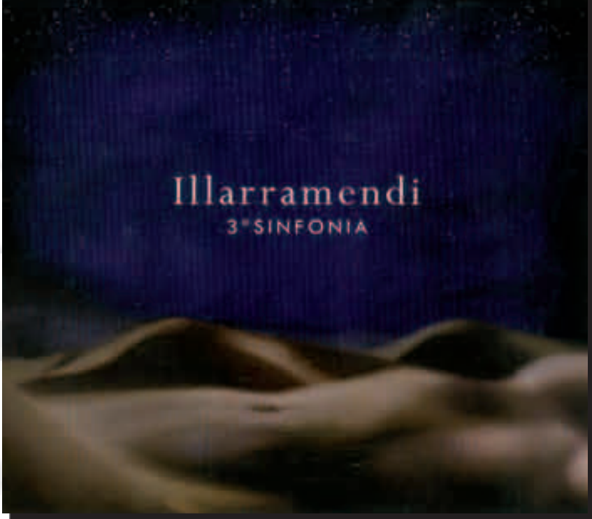
Disco "Illarramendi - 3ª Sinfonía" grabado en Errenteria