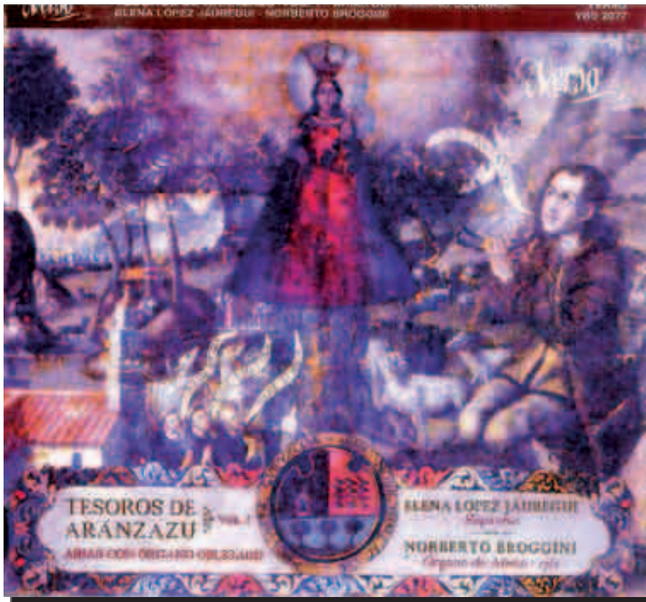
Disco "Tesoros de Arantzazu. Vol.1"