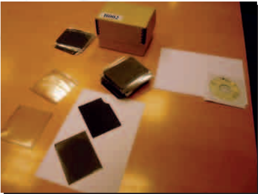
Cristales con imágenes de partituras de A. Isasi