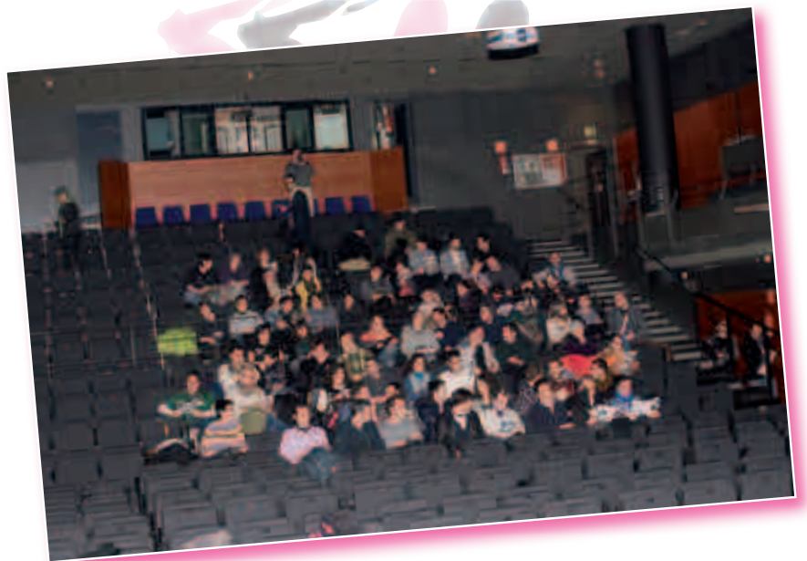
EHGAM Glam Zinema.