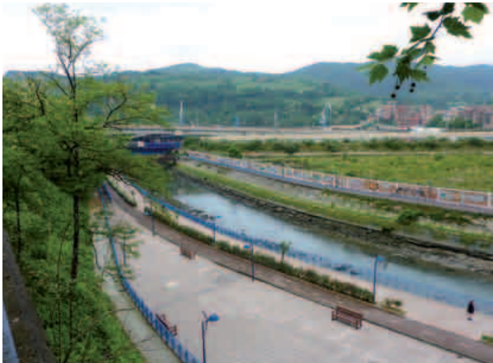
Iztieta-Ondartxotik ikusia, hemen dagoen irudia behin behinekoa da.

ten den moduan. Errenterriari dagokionez ere zor zaio trenbidearen eta errepidearen muga deuseztatzea edo, bederen saretzea. Ez dakigu geroa nolakoa izango den, egitasmo hauek gauzatuko diren ala Masterplana papelean eta balizko errealitatean geratuko den, baina argi da Errenterriak itsasoarekin izan zuen lotura berreskuratu behar duela. Portu izateko sortu zen hiribildu honi, Errenterriari, itsasoaren atea zabaldu egin behar zaio.