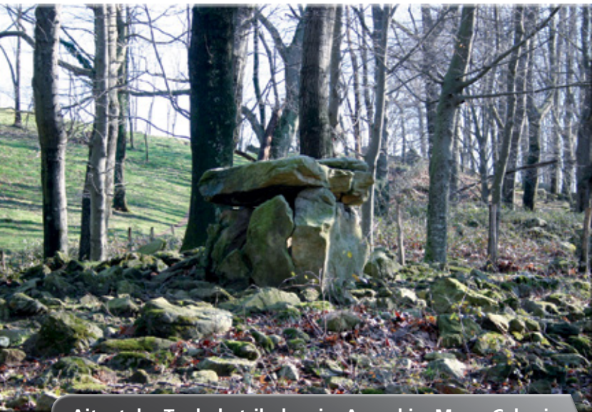
Aitzetako Txabala trikuharria.

tela kanpamenduak, bai kobazuloetan, bai aire zabalean. Baliteke Ametzagainan (Donostia) aire zabalean aurkitutako aztarnategia kanpamendu hauetako bat izatea, eta baliteke beste asko oraindik aurkitu gabeak izatea. Geroago, nekazari eta abeltzain bihurtu ondoren, gizataldeek paisaia baratzak, soroak eta zelaiak landu zituzten, eta horiek zaintzeko lurraldean finkatu ziren. Bizimodu egonkor horren ondorioz, hildakoak leku berdinan gordetzeko beharra sortu zen, haitzuloetan, edo haitzulorik ez dagoenean, trikuharrietan.