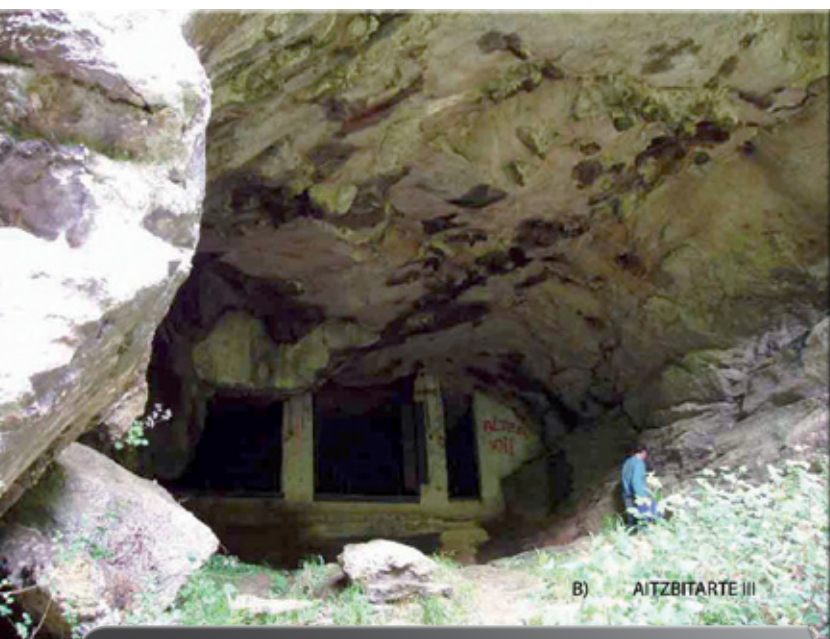
Aitzbitarteko kobazuloak.

E rreenterian Historiaurreko aztarnen ezagutza aspaldiko kontua da, Gipuzkoako lehenbiziko indusketa arkeologikoa Aitzbitarteko (Landarbaso) kobazuloetan egin baitzen 1892an. Orain arte ezagutzen ditugun Historiaurreko aztarnak, ordea, ez dira oso ugariak, eta bi multzotan banatu daitezke: