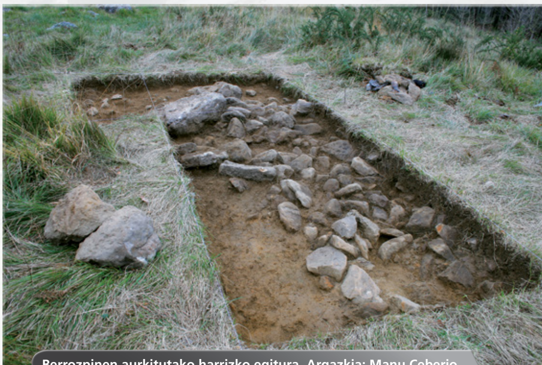
Berrozpinen aurkitutako harrizko egitura.

Azkeneko kanpainan (2011) kata bat hasi dugu Berrozpinen, lur azpian piezak edo bestelako aztarnak aurkitu nahian. Hasieran 2x2 metroko laukia industean, harrizko blokez egindako egitura bat azaldu zen, eta hura aztertu ahal izateko laukia 14 metro karraturaino zabaldu dugu. Orain arte ikusi dugunez, egiturak trikuharri baten tumulua ematen du, hilobia estaltzeko lur eta harriz osatutako multzoa, gainean lauza handi bat daukala. Oraingo zehaztasun guztiz ez bada ere, trikuharri berri bat izan daitekeela esan dezakegu, eta datorren kanpainetan gai hau argitzen saiatuko gara.