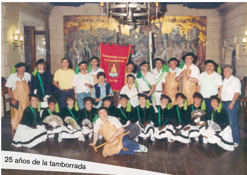
25 años de la tamborrada