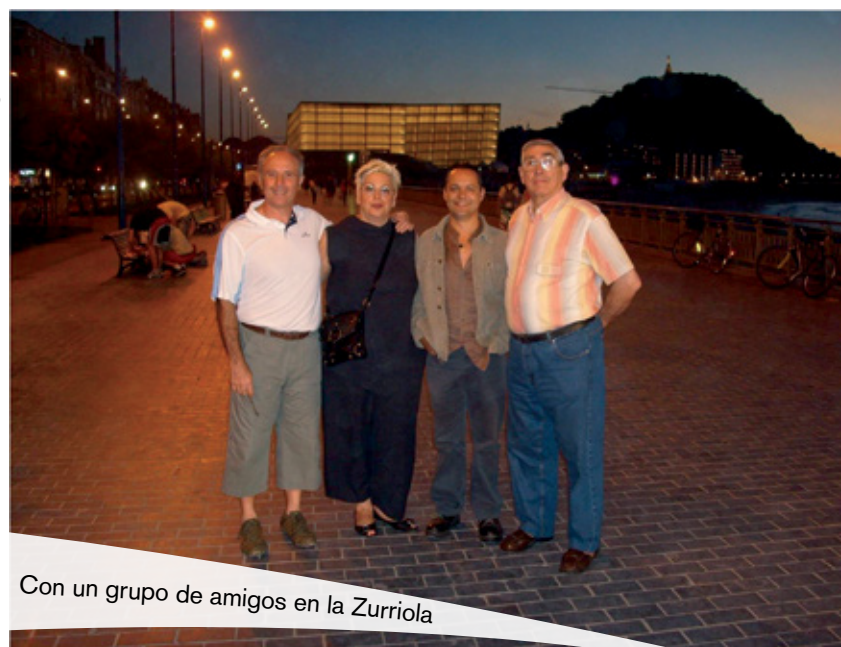
Con un grupo de amigos en la Zurriola