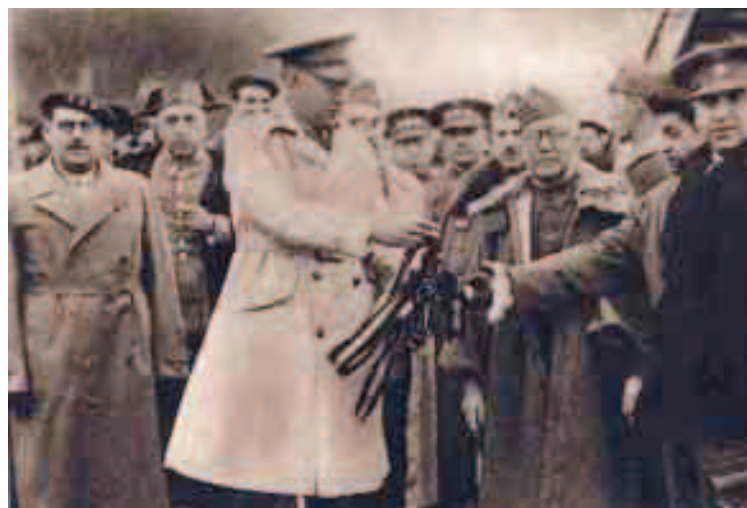
Mola jenerala zubiaren inaugurazioan (1937-02-01).