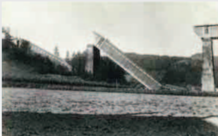
Zubia moztuta (1936ko iraila).

duzenak: hor dago Irizar autobus fabrika ezaguna, Irizarren karrogeak XX. mendean atarian sortua. Industriak, bainuetxeak eta trenbideak bultzatuta, zerbitzuen arloan ere osatuz joan zen Ormaiztegi, fonda, ostatu eta abarrekin. Gainera, errepide sarean ere ondo kokatua zegoen, Beasaindik Durangorako bidean.