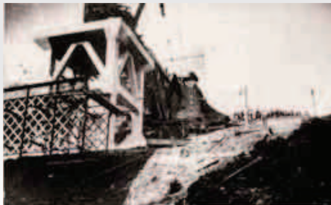
Zubia konpontzen, egun eta gaueko lanean (1936-1937).

Kanpotik ekarritako langileak ziren eta herriko etxeetan egon ziren apopilo. Egunez eta gauez, hogeita lau orduetan aritu ziren lanean, gaua egun bihurtzen zuen argiztapenarekin. Zubia indartu egin zuten gainera, hormigoizko zutabe berriak eraikiaz, lehengo harrizkoen tartetean.