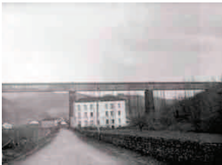
Zubia eta bainuetxea (1914).

1863an eraiki eta hurrengo urteko abuztuan zabaldu zuten, Madril-Paris linea inauguratzean. 289 metroko luzera du eta 34 metroko altuera punturik gorenean; bi mendixka lotzen ditu: bata Beasain aldera, hilerria eta geltokia kokatzen direnekoa, eta bestea, Zumarraga aldera, Gabiriaranzko oinezko bidea doanekoa. Azpitik, Gabiriara eta Liernira daraman errepideak zeharkatzen du zubiak. 1912an bikoiztu egin zuten trenbidea eta 1928an elektrifikatu.