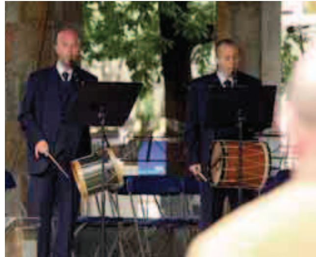
Errenteriako Udal Txistulari Taldea.