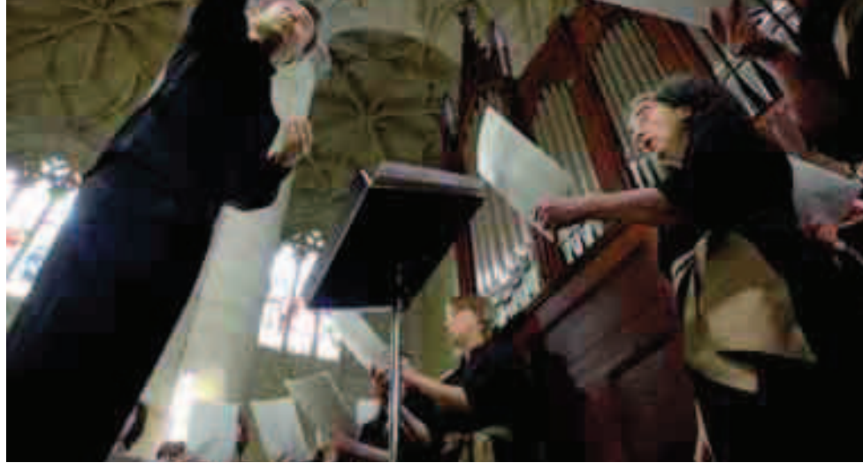
Andra Mari Abesbatza Jasokundeko Elizan.