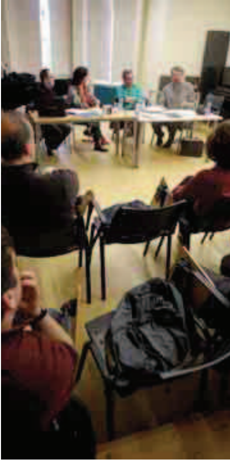
"En torno a las publicaciones de música en el País Vasco", topaketa Musikenen.