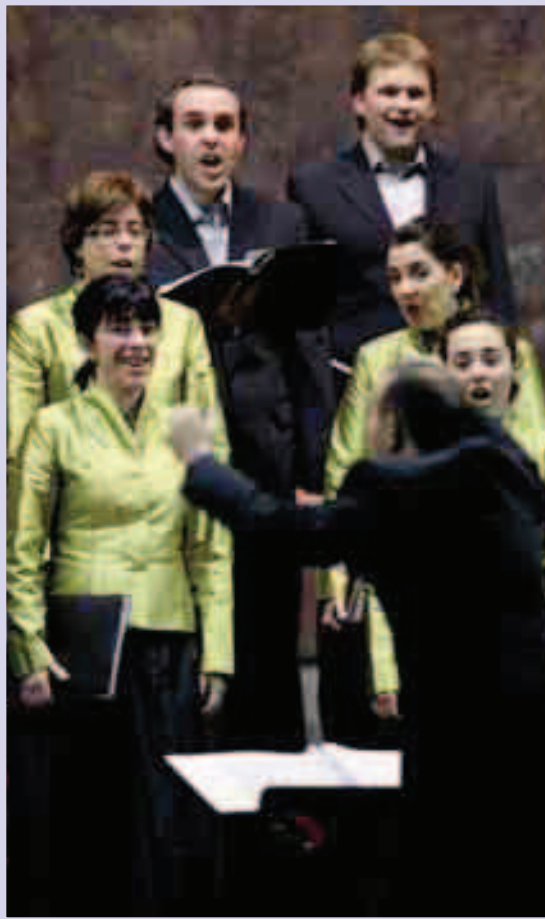
Landarbaso Abesbatza Musikasteko Koruen egunean.