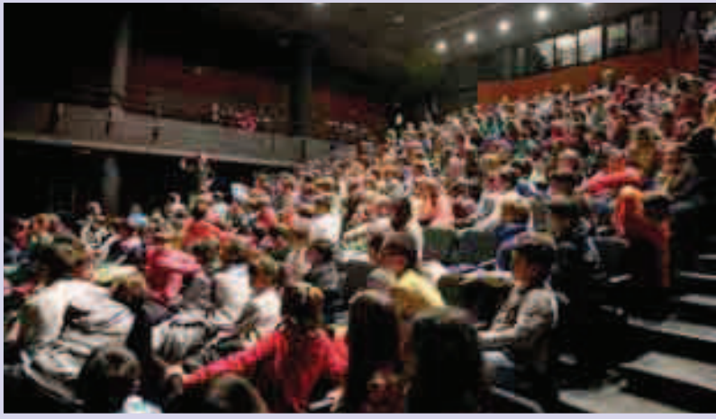
Musikasteko Kontzertu Didaktikoa.