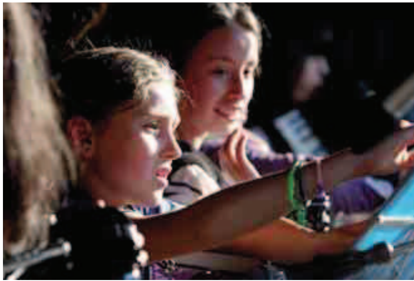
Musika Eskolen Emanaldia.