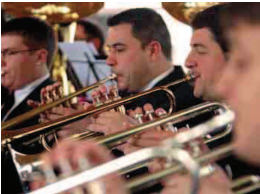
Errenteriako Musika Kultur Elkarteko Banda.