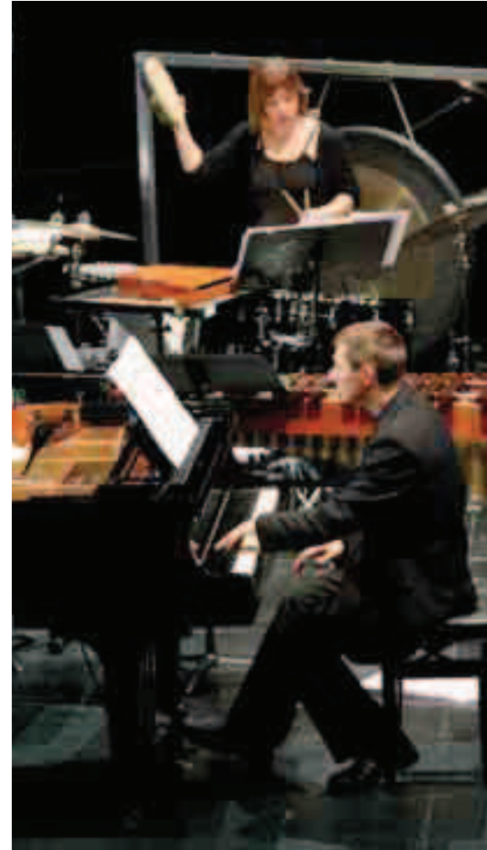
Musikaste 2013ko Musika garaikidea Ensemble Espacio Sinkro-ren eskutik.