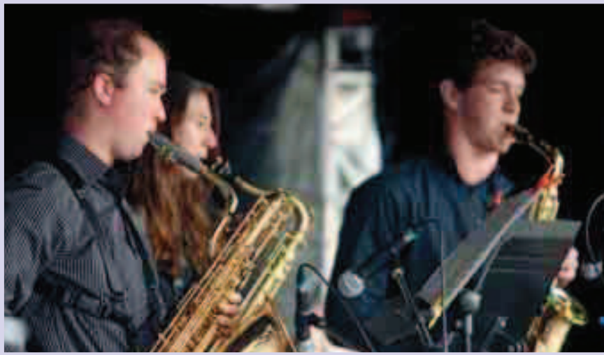
Schorndorf-eko musika eskolaren saxofoi taldea.