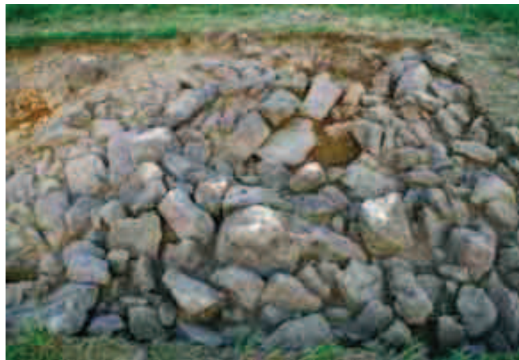
Ezaugarri arkitektonikoak: tumulua, eraztuna eta ganbara.