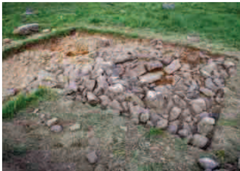
Indusketa eremuaren ikuspegi orokorra.