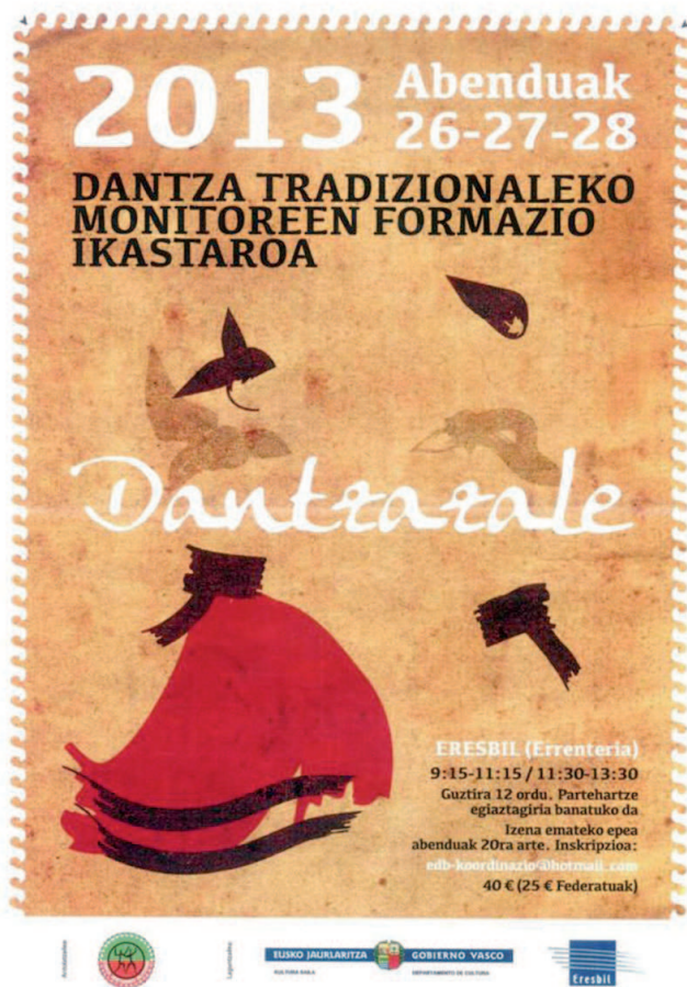
Cartel anunciador del curso "Dantzazale" realizado en ERESBIL.