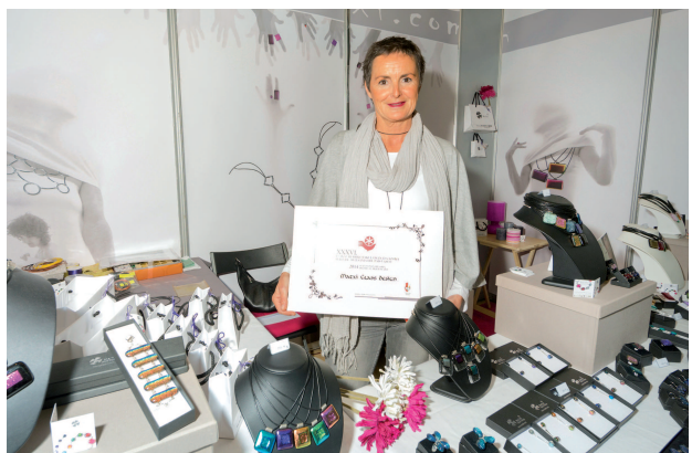
Stand onenaren saria.

Bi sari hauek azokan bertan banatu ziren maiatzaren 2an, ostiral arratsaldean, eta haien berri komunikabide guztiei eman zitzaizkien, irabazlearen aipamen labur batekin.