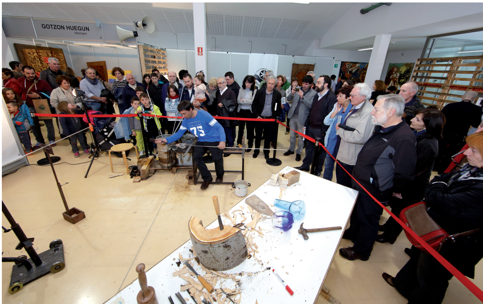
Beira eta taila tailerra.

Testuinguru horretan kokatu behar dira "sormen eta berrikuntzako diziplina anitzeko tailerrak". Horien xedea izan da eskulangintzako zenbait diziplinaren arteko elkarlana sustatzea harreman eta sinergia profesionalak sortze aldera, eta hauen bitartez, azken finean, artisau produktuaren "berrikuntza" lortzea. Emaitza, eskulangintza bizia da, garaikidea eta kalitatezkoa, "lankidetzaz" eta