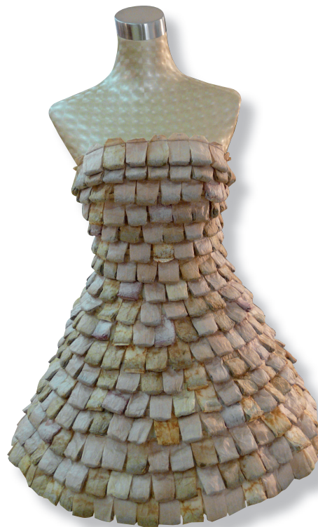
Te poltsekin egindako soinekoa.

Orain arte artisaua, bakarkako lan baten bitartez egilea izatez gain, bere produktuaren