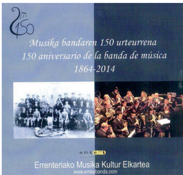
Disco remasterizado en ERESBIL.