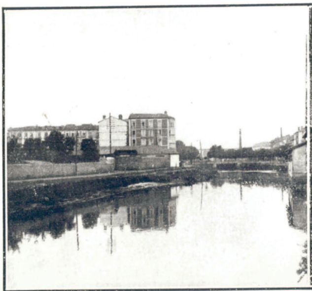
RÍO OYÁRZUN, EN LOS ALREDEDORES DE LA VILLA

Etxebizitzari buruz, aipatutako Martin Mozoren txostenak etxe berriak –orduan Biteri kaleko ingurukoak eta “Etxeberrietako” auzokoak– higiene aldetik ikusita aski egokiak zirela esaten zuen, baina gainerako herriko etxebizitza guztiak eskasak, osasun gaitzekoak eta botatzea merezi zutela. Hau guztia fabrika asko herri-gunean bertan kokatuak zeudela ahaztu gabe eta etxebizitzetara kea, zarata eta ur zikinak noiz edo noiz botatzen zituztela.