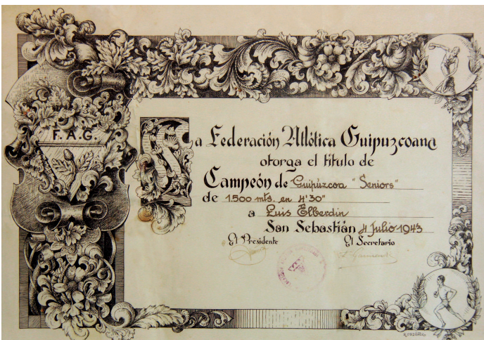
04-07-43. Título que acredita el campeonato absoluto de Gipuzkoa de los 1.500 metros lisos en pista.