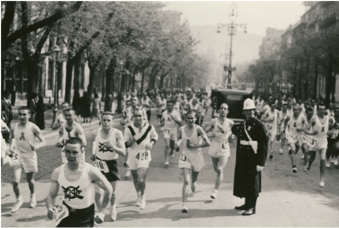
12-04-42. El régimen dictatorial no permitía cicatrizar las heridas provocadas por la Guerra Civil y se mantuvo presente en todas las facetas de la vida política, económica, cultural y deportiva, infiltrándose en la participación y organización de carreras de campo a través. La foto corresponde a la Prueba de Clausura de la temporada '41/'42 celebrada en Donosti.