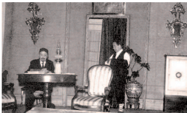
Donostiako Antzoki Zaharrean Dollorra dramaren irudia.